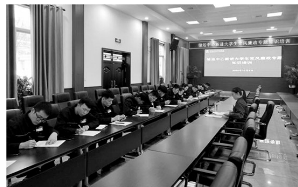
近日,陕钢集团龙钢公司储运中心组织17名入职大学生,以“珍惜新岗位,把好廉洁关”为主题,开展党风廉政教育培训,切实增强新入职大学生廉洁从业意识,筑牢拒腐防变第一道防线。图为该中心入职大学生正在认真聆听授课。