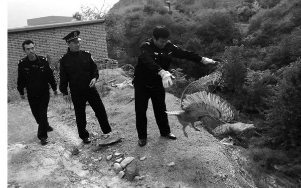
“我们一松手,它扇动翅膀迅速回归山林。”近日,一只翼展达60公分的国家二级保护动物猫头鹰误入韩城矿业桑树坪二号井污水处理站。该矿经保人员接警后立即赶到现场,采用渔网将其套住,并合力将其放生...