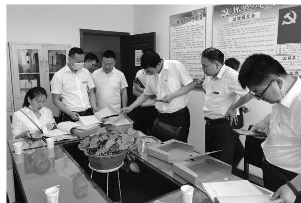
日前,彬长矿业胡家河矿紧紧围绕安全发展稳定大局,开展丰富多彩的系列主题活动...