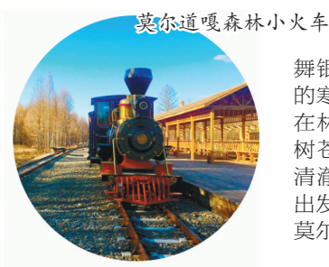
莫尔道嘎森林小火车

出游贴士:乘坐飞机到哈尔滨或者牡丹江,转乘高铁、雪乡龙运直通车,往返于各个景区和城市之间。住宿可选择雪韵阁大酒店、农家小院、木刻楞别墅等。随便走进一家雪韵大街两侧的民宿,点一份猪肉炖粉条、小鸡炖蘑菇、鲑鱼炖茄子等“雪乡八大炖”,或是点一份东北林区特有的山野菜、铁锅炖冷水鱼、火锅等,都是当地地道的美味。