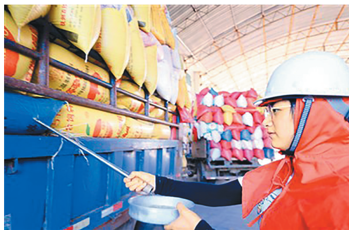
在江西省吉安市泰和县中央储备粮泰和直属库有限公司,员工正在对稻谷进行抽样检测,确保粮食收购入库质量。

在中央储备粮北京顺义直属库有限公司,能听到许多员工讲起这样的往事。2008年北京奥运会,会上所需的面粉原料就是由