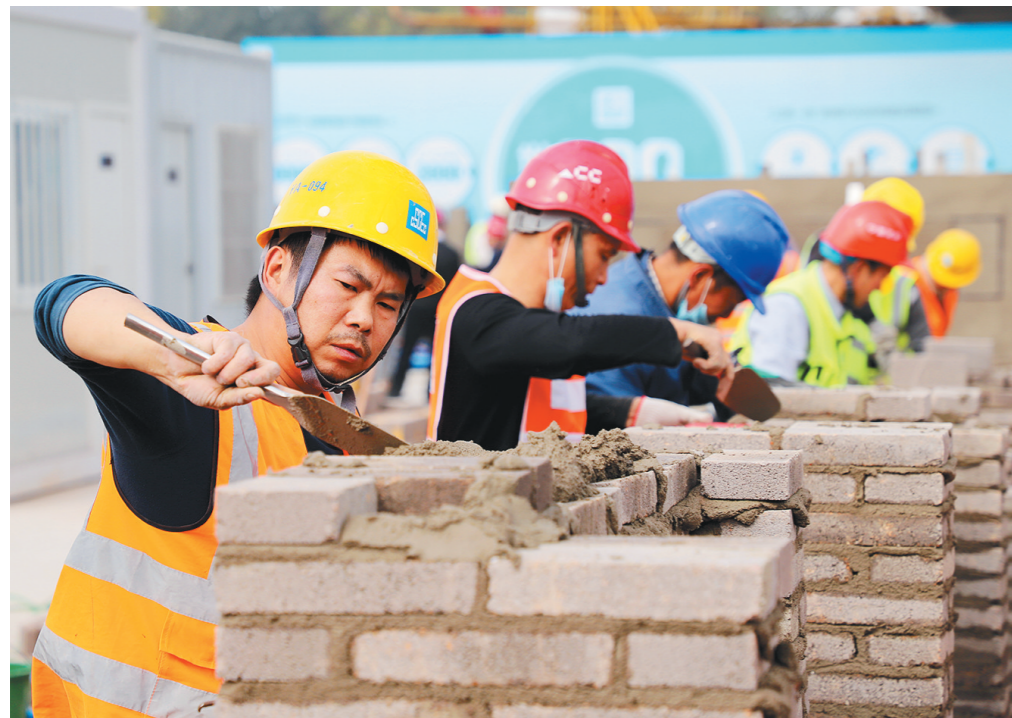
11月3日,第五届“长安建筑大工匠”技能比武大赛在中建五局西北公司金融创新中心项目工地展

梦想的种子一旦播撒,便有了破土而出的力量。从现在到2035,青春之路充满希望,逐梦征程任重道远。永葆奋斗的朝气、创新的锐气、担当的勇气,必有青春之我、青春之中国、青春之人类。