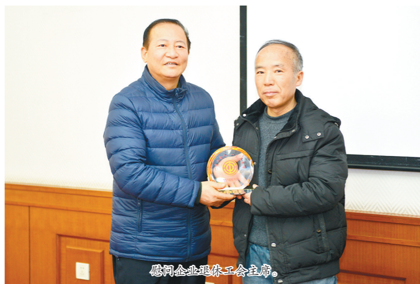
慰问企业退休工会主席。