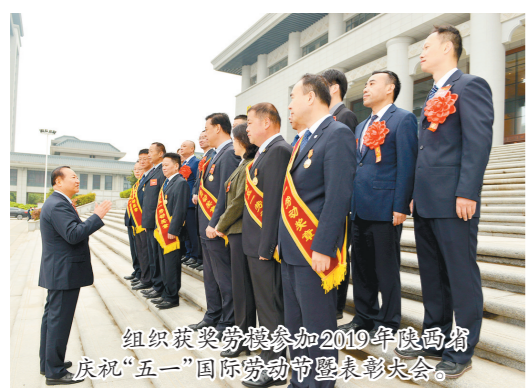
组织获奖劳模参加2019年陕西国防系统“五一”国际劳动节表彰大会。

同时,为解决国防系统优秀职工多,而荣誉少的矛盾,陕西省国防科技工业劳动竞赛委员会于2019年开始评选陕西国防科技工业劳动模范,并将国防劳模作为更高层次劳模评选的基础荣誉,这在全国产业工会属于首创,极大地激发了广大职工岗位成才的热情。