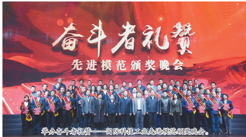
举办奋斗者礼赞——国防科技工业先进模范颁奖晚会。