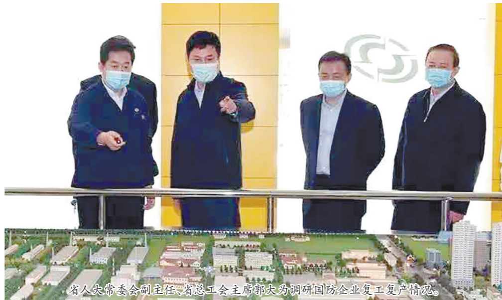
省人大常委会副主任、省总工会主席郭大为调研国防企业复工复产情况。

陕西省国防工会成立于1954年,是正厅级建制的省级产业工会,覆盖航空、航天、兵器、船舶、邮政、电子、核工业、通信等八大行业243家企事业单位的近30万职工。 我省国防科技工业体系齐全,产业体量和科研实力在全国有着举足轻重的地位,其中航空航天产业聚集了全国30%的研制生产能力,兵器科研与装备制造占全国近半比重。全系统汇集了大批国防科技工业的高端科研人才和高技能人才,广大职工砥砺前行、创新发展,为建设强大国防和我省经济社会发展作出了突出贡献。 近年来,省国防工会在省总工会的坚强领导下,深入学习践行习近平总书记关于工人阶级和工会工作的重要论述,把团结带领陕西国防职工为实现中华民族伟大复兴而奋斗作为首要任务,把维护服务好广大陕西国防职工作为基本职责,不断推进工作创新,各项工作取得显著成效。