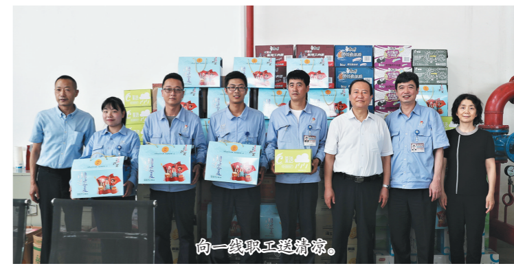
向一线职工送清凉。

解决了女职工生育后顾之忧。2019年,陕西省国防工会女职工委员会获省总工会“母婴室建设工作推进奖”和“爱心托管服务创新工作奖”。 国防工会文化日益繁荣。全系统有全国职工书屋示范点38个,超过98%的单位有固定的职工文化场馆。陕西省国防科技工业职工文联下设职工作家、舞台艺术、书法美术、摄影和体育等5个专业协会,集聚职工文艺人才500余名,有3名职工文艺人才被授予陕西省职工艺术家称号,一大批职工优秀文艺作品和一线职工在央视“五一”晚会和陕西省“五一”晚会的舞台上大放异彩。特别是2019年高标准举办的“奋斗者礼赞·陕西省国防科技工业先进模范颁奖晚会”,展示了劳模和一线职工的风采,取得了良好的社会反响。