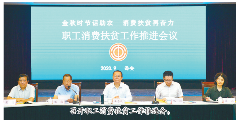
召开职工消费扶贫工作推进会。

组织充分发挥工会资源和优势,积极投入决战决胜脱贫攻坚战役中。全系统参与对口扶贫的企事业单位大部分由工会具体承担扶贫工作。今年6月份,省总工会提出开展陕西工会百万职工消费扶贫行动后,省国防工会立即响应,制定工作方案,建立职工消费扶贫数据台账,提出激励奖励措施,并利用“送清凉”和“中秋、国庆”时间节点,两次召开职工消费扶贫推进会。目前,国防工会系统职工消费扶贫金额已达到7500余万元。