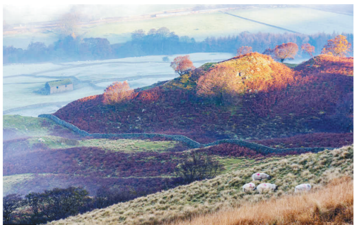
11月8日,英国德比郡峰区公园,日出晨雾美景撩动如仙境。