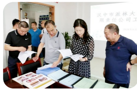
厂务公开民主管理调研。