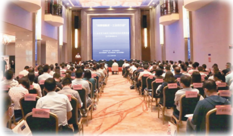
全市消费扶贫签约仪式。