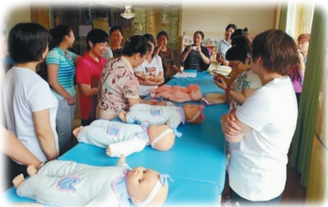
家政服务技能大赛。