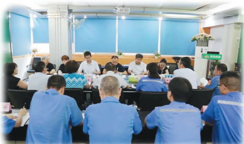
非公企业星级工会评定。