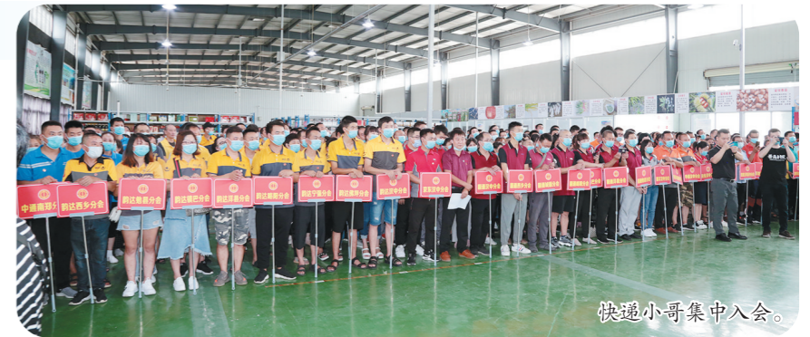
快递小哥集中入会。

新星评比,组织1100余名职工参与就业创业技能培训,开展劳模工匠网络“微课堂”6期。还先后组织开展“争做雷锋式职工助力疫情防控和企业复工复产”志愿者活动、“阅读经典好书、争当时代工匠”读书活动、“抗疫促生产、夺取双胜利”主题劳动竞赛活动、“六比一创”劳动竞赛以及“同舟共济渡难关,携手共进促和谐”集体协商要约行动,多渠道、多途径提升职工素质,促进广大职工立足岗位做贡献。