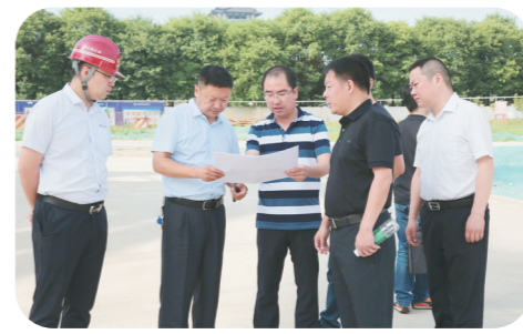
调研工人文化宫建设情况。