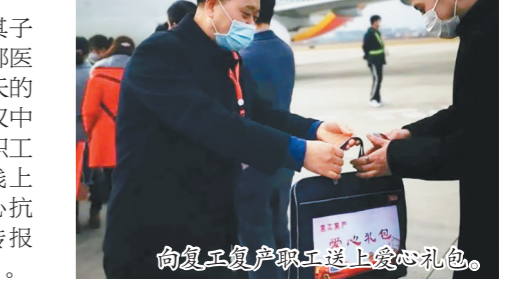
向复工复产职工送上爱心礼包。

鄂医护人员代表、战疫一线医务职工代表及其子女60余人,开展“六一”研学活动;组织22名援鄂医护人员及18名抗疫一线医护人员开展为期4天的疗休养活动。广泛宣传战疫先进典型,借助“汉中工会”微信公众号,宣传防控知识、防疫一线职工故事以及开展“全国职工新冠肺炎防控知识线上有奖竞赛”等活动,营造众志成城、万众一心抗击疫情的舆论氛围。疫情期间,共刊载宣传报道60余篇,部分篇目被各大媒体相继转载。