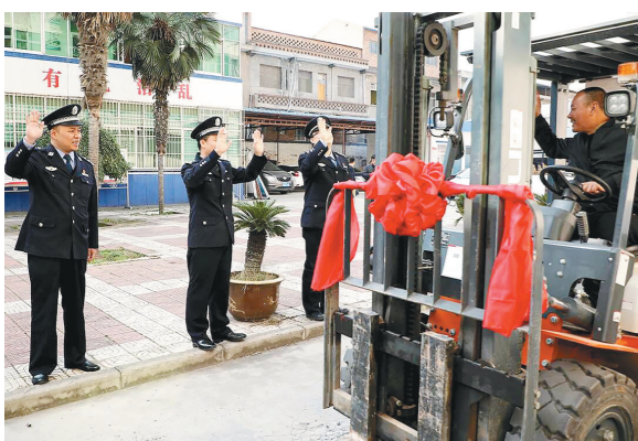
11月9日,骊车机动队向渭南市公安交警分局渭北分局北路口交警中队民警送去慰问品,感谢他们为自己找回失窃的工程叉车。

本报讯(记者 牟影影)11月11日,记者获悉,西安高新区(自贸试验区西安高新功能区)、经开区(自贸试验区西安经开区)、浐灞生态区(自贸试验区西安浐灞生态区)及国际港务区(自贸试验区西安国际港务功能区)联合推出258项政务事项“四区通办”,让开发区及自贸功能片区企业群众享受自贸试验区改革红利,为加快实现西安“同城通办”积累经验。