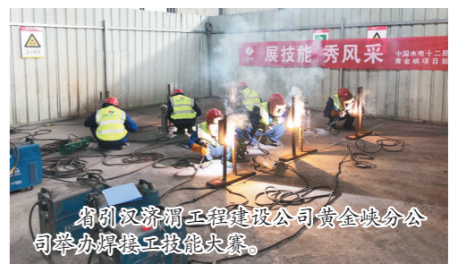
省引汉济渭工程建设公司黄金峡分公司举办焊工工技能竞赛。

活动,表彰省农林水利气象系统生态文明建设先进集体34家,先进个人28名,1名职工荣获全国“绿色生态工匠”称号。不断提升履职能力水平。举办了6期工会干部和工会业务培训班,培训工会干部和职工代表500余人次。高度重视理论研究工作,紧紧围绕工会组织状况、产业工人队伍建设、厂务公开民主管理、职工书屋建设、工会财务、企事业单位工会撤并、女职工工作、工资集体协商8个重点问题,集中一个月时间开展“深入基层摸实情,梳理关系增活力”大调研活动,全面掌握新整合工会会员总数、经费收缴渠道和工作现状等“干货硬料”,形成调研报告22篇,为推动工作发展打下了基础。(惠小峰 李可)