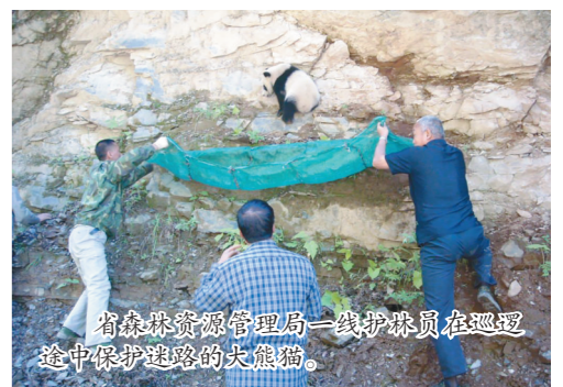
省森林资源管理局一线护林员在巡护途中保护迷路的黑熊猫。