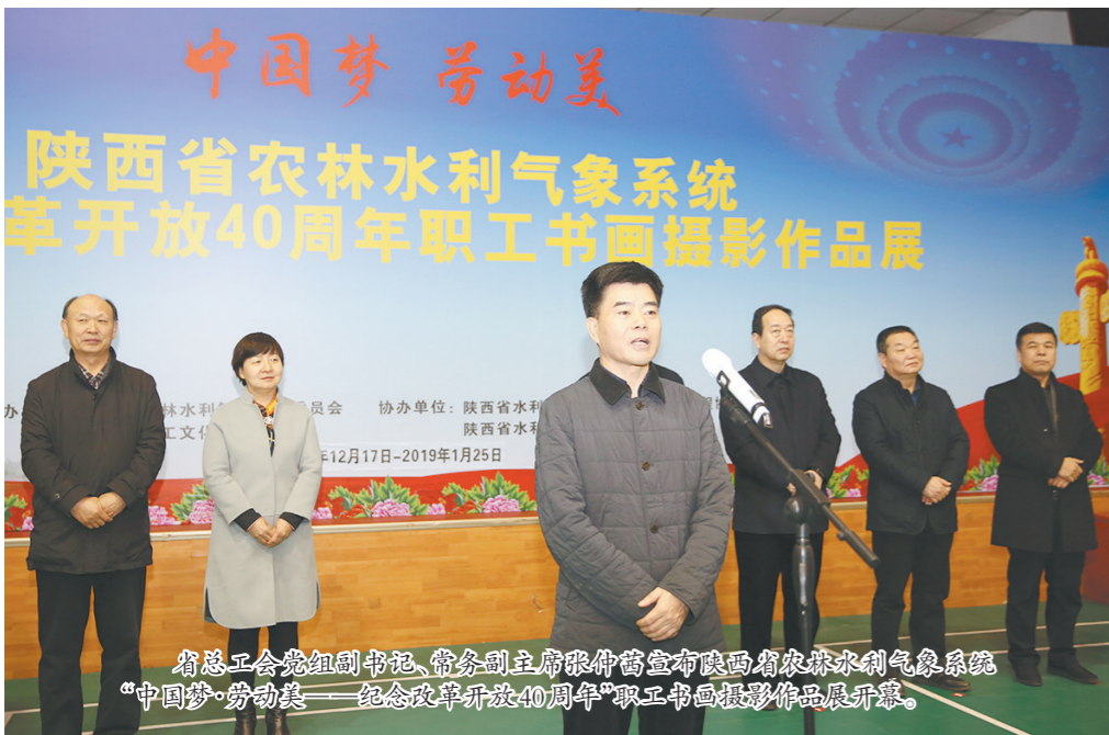
中国梦 劳动美 陕西省农林水利气象系统 革开放40周年职工书画摄影作品展

近年来,省农林水利气象工会坚持以习近平新时代中国特色社会主义思想为指导,全面贯彻落实省总工会“往职工中走、往心里做、往实处落”行动要求,坚持理论武装,在提升政治站位中发挥团结引领作用;坚持服务大局,在推动生态文明建设中发挥助推作用;坚持维权服务,在满足职工对美好生活向往中发挥支撑作用。教育引导广大职工群众在乡村振兴、绿色发展、柔性治水、防灾减灾、粮食安全、治本安全等工作中奋力奔跑,以昂扬斗志谱写陕西新时代追赶超越新篇章!