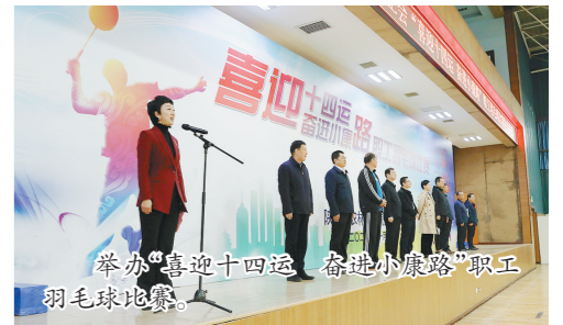
举办“喜迎十四运 奋进小康路”职工羽毛球比赛。

体、3名个人荣获全国和省级安康杯竞赛先进单位和个人称号。劳模服务管理周到细心。向4名全国劳模颁发了“庆祝中华人民共和国成立70周年”纪念章。为150名全国和省部级劳模发放专项补助资金51万元。三年来,共23家单位(集体)荣获全国和陕西省五一劳动奖状及工人先锋号,17名产业职工荣获全国和陕西省五一劳动奖章。1名劳模荣获“最美劳动者——新中国成立以来陕西最具影响的劳动模范”称号,1名劳模获得提名奖。表彰命名陕西省农林水利气象系统“五一巾帼标兵”10名、“五一巾帼标兵岗”10个。组织200名劳模先进和200名一线职工参加疗(休)养。全力组织动员广大职工积极投身疫情防控总体战、阻击战,开展“抗疫情促生产、夺取‘双胜利’”主题劳动竞赛,拨付疫情防控专项资金31万元,慰问疫情防控一线职工和助力企业复工复产。