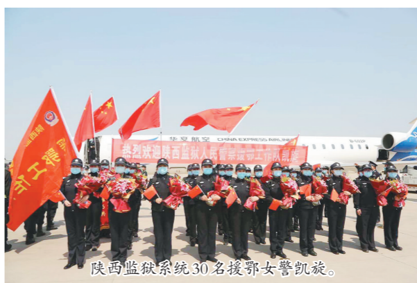
陕西监狱系统30名援鄂女警凯旋。