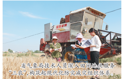
省气象局技术人员深入田间地头服务“三农”,构建起现代化防灾减灾组织体系。

筑梦”服务农民工公益法律服务活动5场次,为重点工程建设领域的近1000余名参建农民工发放普法宣传册。指导8家省属企业探索建立听证会制度。服务职工温暖人心。多方筹措专项资金488.4万元,持续开展“四季送”慰问帮扶活动,经常性普惠措施更加贴心温暖。通过动态管理与精准帮扶、大病互助等手段,让困难职工真切感受到组织的关怀。开展“致敬城市美容师——工会暑期关爱季”活动,为100名环卫工人、城管、快递员、自行车调度员等送去4000箱饮用水等慰问品。精准助力脱贫攻坚。突出产业特点优势,把来自深度贫困地区农特产品编制成扶贫产品目录,在全系统发起“消费扶贫·爱心行动”倡议。