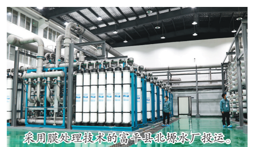
采用膜处理技术的富平县北塬水厂投运。