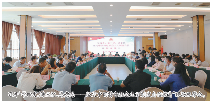
召开“学四史、讲三忆、感党恩——坚定中国特色社会主义制度自信教育”现场观摩会。