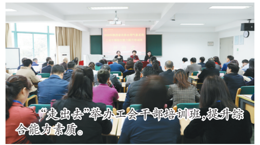
“走出去”举办工会干部培训班,提升综合能力素质。