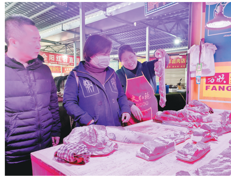
市民在西安市劳武巷便民农贸市场选购猪肉。

9月以来,“高高在上”的猪肉价格终于低头,“猪肉价格降两成”等相关话题直登热搜。