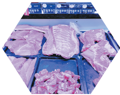
西安人人乐超市玉祥门店的猪肉价格。

中国特色社会主义制度具有强大生命力和显著优势,是当代中国发展进步的根本保证。党的十八大以来,以习近平同志为核心的党中央把制度建设放到更加突出的位置,在加强和完善国家治理方面取得历史性成就,中国特色社会主义制度更加完善,国家治理体系和治理能力现代化水平明显提高。进入新发展阶段,为应对风险挑战、赢得战略主动,顺利实现第二个百年奋斗目标,就要与时俱进坚持和完善中国特色社会主义制度、推进国家治理体系和治理能力现代化。“十四五”时期,要锚定到2035年基本实现国家治理体系和治理能力现代化,基本建成法治国家、法治政府、法治社会的目标要求,按照党的十九届四中全会《决定》作出的顶层设计,推动各方面制度更加定型、国家治理效能得到新提升。要健全人民当家作主制度体系,加强社会主义民主法治建设,健全党和国家监督体系,深化行政管理体制改革,构建基层社会治理新格局,完善防范化解重大风险和突发公共事件应急体制机制,提升安全发展能力,建设更高水平的平安中国,全面推进国防和军队现代化,坚决维护香港、澳门长期繁荣稳定,坚定推进两岸关系和平发展和祖国统一。