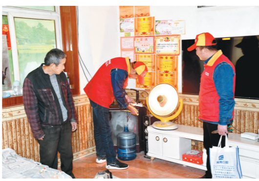
近日,国网西安供电临潼公司以“党建+供暖”服务模式,成立了7支流动“红马甲”党员服务小分队,入户宣传冬季取暖安全用电知识,确保千家万户温暖过冬、清洁取暖。

在决赛中,作为2020年珠峰测量的队员之一,徐伟航以《测量珠穆朗玛峰》为主题,详细介绍测量珠峰的方法,所用的国产仪器设备和测量人员顽强的意志品质。