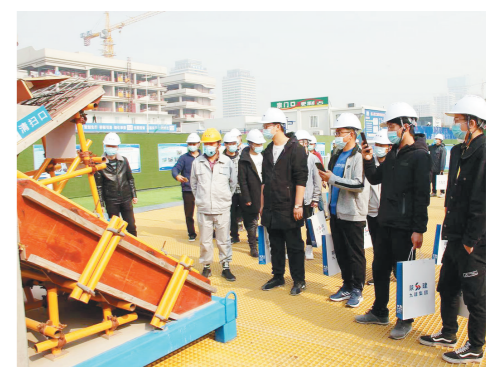
11月10日,观摩人员参观陕建九建集团承建的西部生命科学园建设项目样板区。当日,2020年西咸新区文明工地暨扬尘防治观摩会正式拉开帷幕。