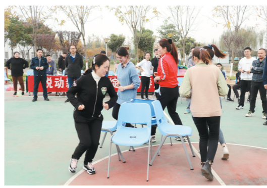
近日,陕西省高速公路建设集团公司汉川分公司举办主题趣味运动会,共有4支代表队50余名职工参加。本次运动会将娱乐与竞赛相结合,充分调动了大家的参与热情。