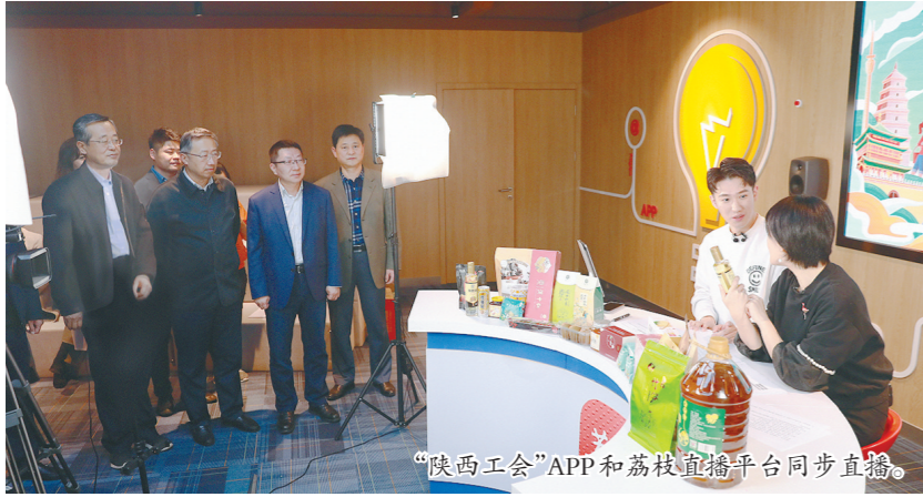
“陕西工会”APP和荔枝直播平台同步直播。