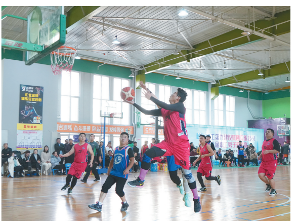
由陕西九建集团工会主办的第八届职工篮球赛,11月26日在榆林闭幕。来自各基层单位的11支参赛队伍,经过2天鏖战,该集团九公司代表队、四公司代表队与机关代表队分获冠、亚、季军。