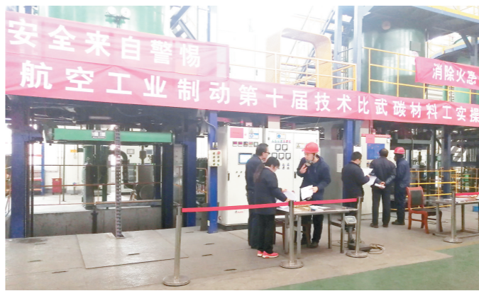
6月至11月,航空工业西安航空制动科技有限公司工会举办了第十届劳动竞赛,本次技术比武共涉及电子仪器仪表装配、热处理工、粉末冶金烧结工等10个工种,近200名技术工人参加比赛。