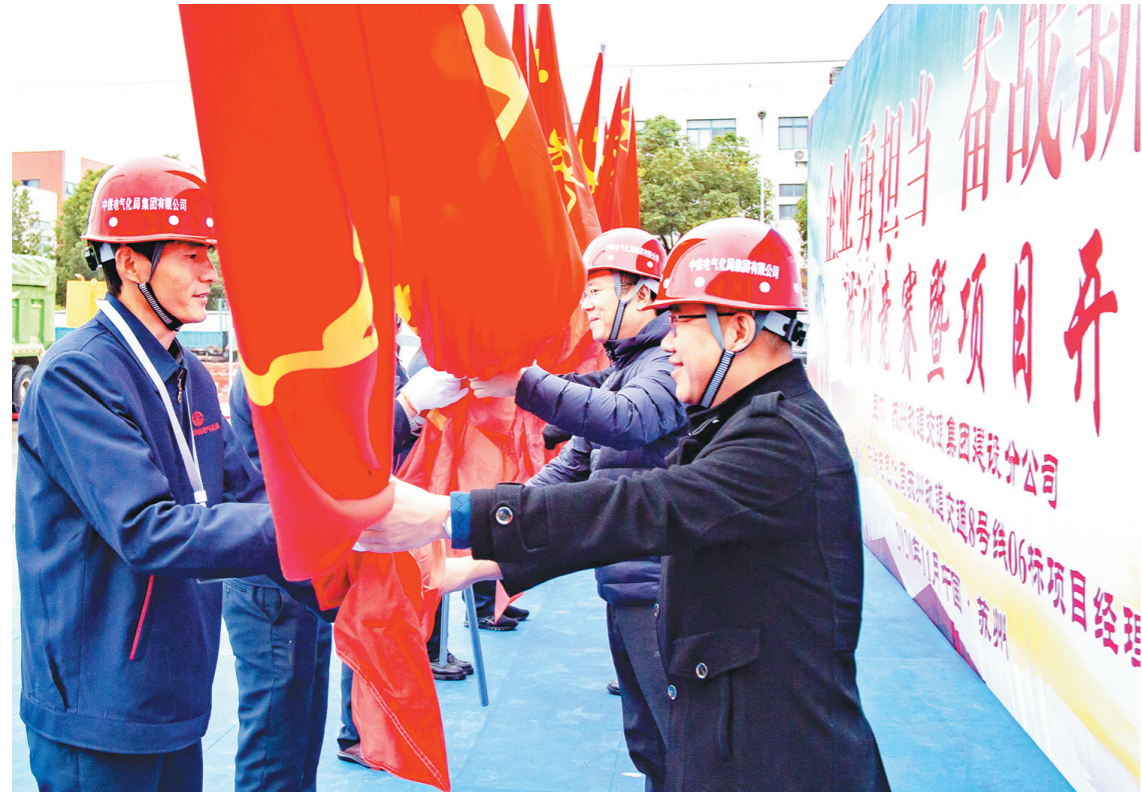
11月25日,在苏州轨道交通8号线地铁工地,中电电气化局铁路工程公司举行“企业勇担当,奋战新征程”劳动竞赛暨苏州地铁8号线06标项目开工仪式。图为与会领导为突击队授旗。