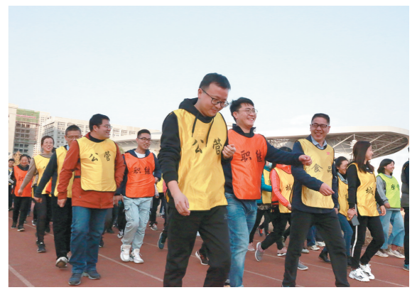
近日,由西北大学工会举办的“路在脚下、心在飞扬”健步走活动在该校长安校区举行。来自29个基层工会的500余名教职工参与其中。