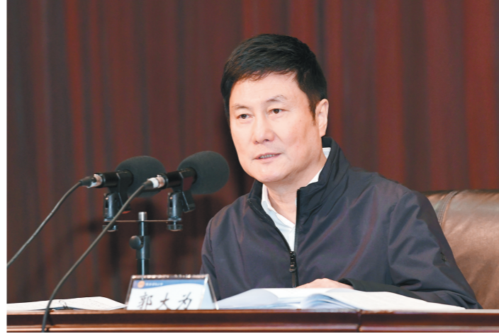
郭大为作专题辅导。

本报讯(记者 阎瑞先)12月1日,省总工会举办“学习党的十九届五中全会精神和习近平总书记在2020年全国劳动模范和先进工作者表彰大会上的重要讲话精神 推进产业工人队伍建设改革”专题培训班。省人大常委会副主任、省总工会主席郭大为作专题辅导,并在辅导前会见了全国总工会副主席(兼)、中国航天科技集团有限公司第一研究院211厂14车间高凤林班组长高凤林。省总工会党组书记、常务副主席张仲茜主持专题辅导会议。