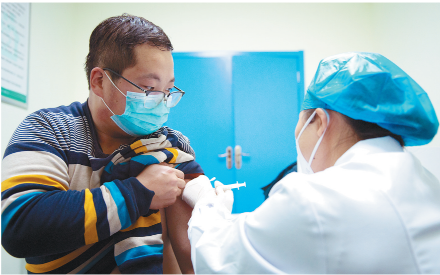
张中心卫生院,12月25日晚,在西咸新区空港新城底张中心卫生院,一名机场工作人员接受新冠疫苗接种。

从2020年12月25日到2021年2月5日,我省将稳妥、有序推进新冠病毒疫苗重点人群接种工作。