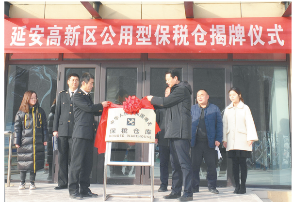
2020年12月29日,由陕建一建集团第三公司承建的延安高新区公用型保税仓举行揭牌仪式,这是延安首个保税仓。该保税仓为进出口企业提供国际采购、国际运输、通关、保税、配送等一条龙服务。

据悉,节假日志愿服务已成为吴靖高速常态化开展的一项实践活动,每逢节假日,志愿者们都会在收费广场、服务区、驻地附近企业和集镇等开展志愿服务活动,这也是突显“红吴靖”服务品牌形象的重要形式之一。