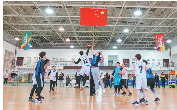
为丰富职工文化生活,激发职工工作热情,近日,中国铁路西安局集团有限公司西安东车辆段举办第七届职工体育节篮球比赛,来自各车间的10支代表队参赛。图为比赛现场。