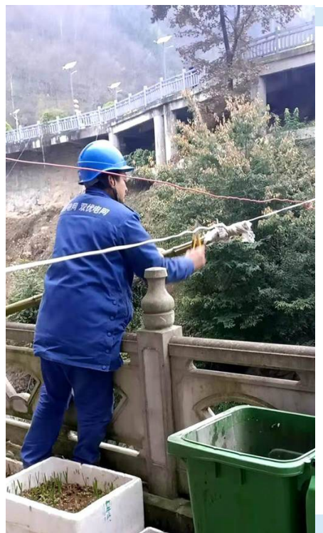
为排除小区居民用电安全隐患,近日,省地电集团紫阳县供电公司工作人员对小区乱接乱搭电线、违规私接公共照明用电、电瓶车乱充电等行为开展专项整治,全面提升家园环境。

据了解,该公司组织本次业务员述职,旨在盘点过去,查找不足,制定措施,为2021年兴化公司销售工作开好头、起好步,激发业务员的工作积极性和紧迫感,为每名业务员营造创新发展、增量提价、比学赶超的浓厚氛围。