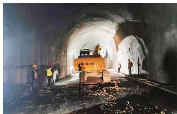
元旦期间,气温持续走低,由中铁二十局集团担负施工任务的高速公路彭西路五标的职工并没有放缓脚步,仍坚守在隧道和两管大桥的关键点位,守护着安全、质量和进度。图为施工现场。