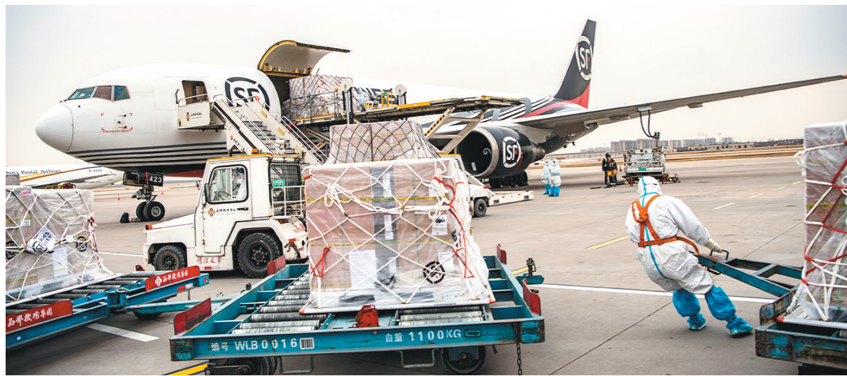
1月16日,西安咸阳国际机场地勤装卸人员身穿防护服装卸货物。当日,一架O37159航班搭载44.6吨三星电子产品从西安飞往东京,标志着西安-东京全货运航线正式开通,这是今年陕西开通的首条国际全货运航线。期间,机场及航空公司严格按照疫情防控要求进行操作,防止疫情传播。

领导小组办公室核发通行证的车外,其余所有车辆,禁止在限行区域内道路行驶。道路交通管制期间,白水县公安局交警大队联合城区疫情防控纠察队在限行区域内设置道路执勤检查点,同时将依托城区所有电子警察、卡口等对所有违反管制通行车辆进行抓拍,严格处罚。 白水县公安局交警大队提醒,疫情期,希望广大交通参与者理解支持配合交警工作。