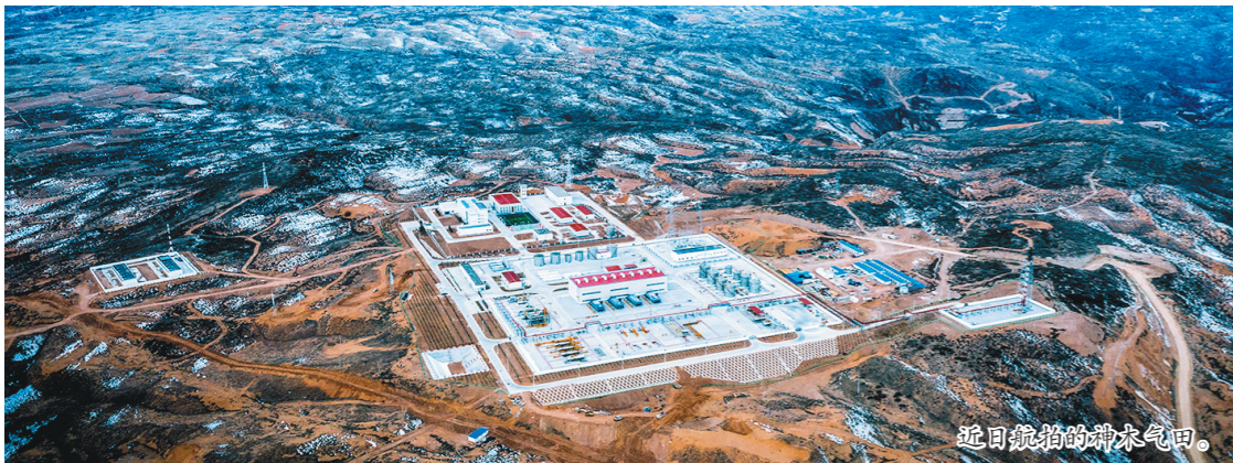
近日拍摄的取水气田。

本报讯(薛涛 杨万忠)2月18日,从长庆油田各主力气区传来捷报,目前气田生产平稳,天然气日产量保持在1.36亿立方米以上,较去年同期提高了1266万立方米。自1997年正式供气以来,长庆油田已累计为国家贡献天然气4753亿立方米,为保障国家能源安全发挥了砥柱中流的作用。