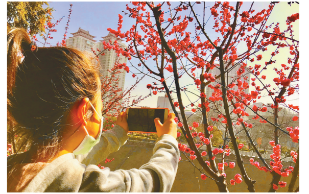
2月19日,西安环城公园春意盎然。图为游人近距离欣赏拍摄。

“现在主体安装已经完成,正在进行地下室二次砌体及地上楼层板施工,预计今年3月底进行内部精装,6月底正常运营,届时运动员们将会体会到更便利、周到的陕西服务。”周智说。 本报记者 赵院刚