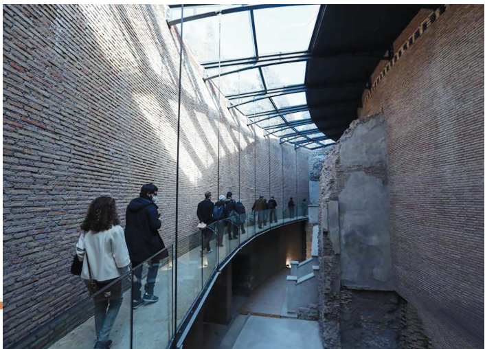
↓3月1日,游客参观意大利罗马的奥古斯都陵墓。罗马帝国开国君主奥古斯都的陵墓于3月2日对公众全面开放,这在其两千多年的历史中尚属首次。罗马市长拉吉早前曾宣布,这座陵墓将在2021年3月2日至4月21日期间对所有人免费开放。