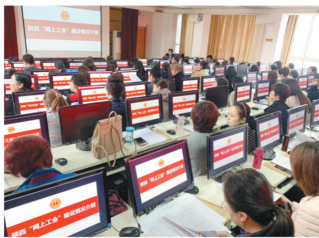
省交通运输工会举办工会组织和会员实名制信息采集工作业务培训。(资料图)

基础不牢,地动山摇。工会实名数据库建设是打造“智慧工会”的“硬核”之一,是工会组织固本强基的基础性工作。