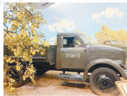
他驾驶过的“13号嘎斯”车。