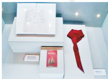
当校外辅导员佩戴过的红领巾。