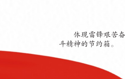
体现雷锋艰苦奋斗精神的节约箱。