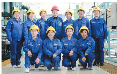
陕煤集团黄陵矿业煤研石发电公司巾帼大学生班组 所获荣誉:全国巾帼文明岗、陕西省巾帼文明岗 奋斗格言:凝聚“她”力量,建功在陕煤!

我们一定会牢记总书记的殷殷嘱托和教导,把“高标准、严要求、行动快、工作实、抢困难、送方便、不让一个伙伴掉队”的“梦桃精神”继续传承和发扬下去。我们也将珍惜和保持来之不易的荣誉,勇敢担当起企业发展和振兴的重任,让梦桃小组的名字更加响亮,用实际行动为“梦桃精神”争光添彩。