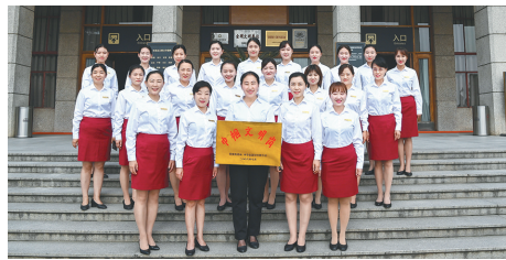
秦始皇陵博物院社会教育部 所获荣誉:全国语言文字工作先进集体、全国巾帼文明岗 奋斗格言:守护中华文明精神标识,讲好世界遗产故事!

“有理想就不会碌碌无为!”展望未来,美好的日子正等着我们去奋斗,企业发展人人有责,只要我们大家共同努力,生活就会更加美好,幸福指数就会继续提升!