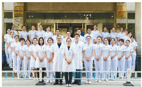
西安交通大学第一附属医院重症医学科 所获荣誉:国家级青年文明号、全国三八红旗集体 奋斗格言:以人为本践初心,重症担当破砾行!

初心致远,未来可期。站在新的历史起点,我们将以“实干创新勇争一流”的奋斗姿态,尽职尽责。一方面将立足岗位,心怀家国,继续发扬“特别能吃苦、特别能战斗、特别能奉献”的作风,不断开拓进取、勇立潮头,为黄陵矿业公司高质量发展而努力奋斗;另一方面将继续以降本增效为目标,以科技创新为手段,以人才培养为动力,从而达到优化生产系统和操作方式,确保机组安全稳定运行,以优异的成绩向建党100周年献礼!