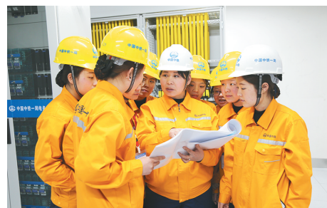
中铁一局集团电务工程有限公司信号女子班组 所获荣誉:陕西省工人先锋号、陕西省五一巾帼标兵岗 奋斗格言:我们是永不开败的轨旁“向日葵”!

秦始皇陵博物院社会教育部承担着为广大观众解读文物、释读陈列、宣传历史文化、进行优秀传统文化普及的光荣任务。现有工作人员63名,其中女职工55名。 自1979年10月秦始皇陵博物院开馆至今,社教部一直以文明热情的接待服务,受到海内外观众的好评。社教部圆满接待党和国家领导人190位,外国元首和政府首脑228位。 42年来,依托“世界第八大奇迹”兵马俑这个平台,不断创新教育项目、探索传播途径、拓展教育传播到世界各地。每年开展各类教育活动200余场次,足迹遍布国内大、中、小学校及中国香港、美国华盛顿等地。2020年策划实施的“兵马俑走进美国学生课堂”,被评为2019年全省宣传思想文化工作创新项目竞赛二等奖。 新时代新征程,社教部秉承“团结向上、刻苦学习、锐意进取、无私奉献”的团队精神,做好“中华文明精神标识”的守护者和传承者。