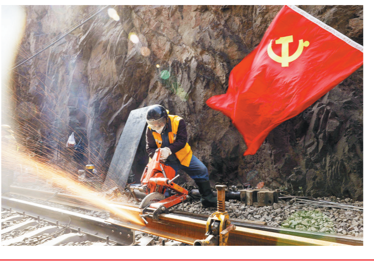
→中国铁路西安局集团有限公司西安工务机械段党委积极组织党员在工作中主动亮身份、展作为,以优异成绩迎接中国共产党成立100周年。图为该段党员在陇海线集中修进行钢轨切割作业。