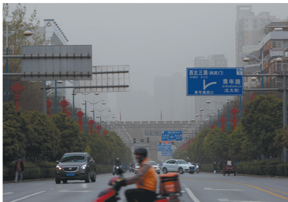
3月16日,西安出现沙尘天气。交警、环卫工人、建筑工人、外卖员等继续坚守岗位,保障城市的平稳运行。

同时预计19日,受冷空气影响,陕北大部和关中北部地区可能出现扬沙或浮尘天气;其他地区扩散条件有利。预计,我省大部地区以良至轻度污染为主;受扬沙或浮尘影响地区部分时段可能出现中度或以上污染。(高敬)