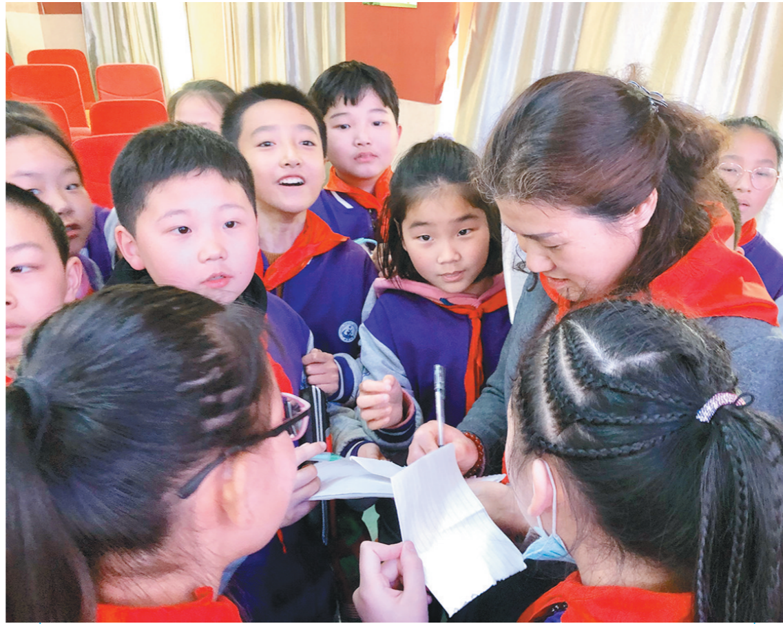
“杨梅阿姨,帮我签个名吧!”全国劳模范杨梅在西安市阎良区迎宾小学宣讲报告会中,学生们自发要求心中的“女神”为自己签名。

莲湖区总工会要求,全区各级工会组织要把党史学习教育成果转化为解决问题的具体行动,不断激发广大干部群众干事创业的精气神,凝聚起砥砺奋进、走在前列的强大合力,彰显工会开展党史学习教育的特色和实效。通过开展党史学习教育,不断提高政治判断力、政治领悟力、政治执行力,更好地肩负起“引导职工群众听党话、跟党走,巩固执政的阶级基础和群众基础”的政治责任;通过开展党史学习教育,从百年党史中汲取继续前进的精神、智慧和力量,更好地履行维护职工合法权益、竭诚服务职工群众的基本职责;通过开展党史学习教育,进一步深入践行新时代党的建设总要求,以党的建设引领工会系统政治建设、领导班子建设、干部队伍建设、党风廉政建设、政治生态建设、制度建设等各项建设全面进步、全面过硬,为莲湖工运事业和工会工作在新阶段开好局、起好步汇聚强大精神动力。