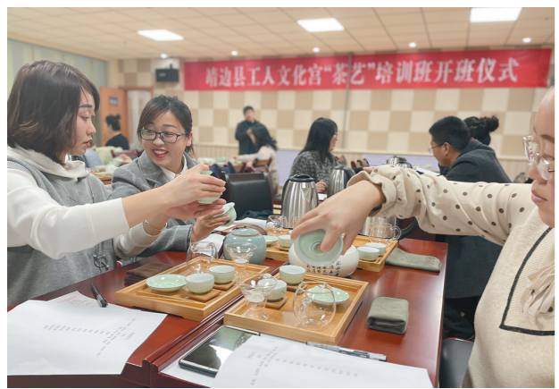
近日,榆林市靖边县工人文化宫开展第二期职工“茶艺”培训活动,全县40余名职工参加。培训结束后进行考核,向合格者颁发结业证。

大家表示,要继承和发扬革命先辈、历代先贤的光荣传统,践行党员的使命担当,为实现新时代党的历史使命和工运事业的发展而不懈努力奋斗。