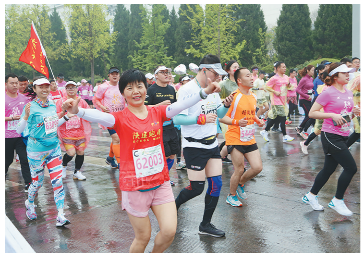
4月11日,“我要上全运”百场马拉松·2021美畅杨凌农科城马拉松活力起跑。15名“陕建跑团”达人和陕西化建130余名长跑爱好者跻身赛道,为大赛增添一道魅力风景。陈练斌 摄

多举措提升服务,推动中欧班列长安号再次实现跨越式发展。西安国际港务区以服务中欧班列长安号关联企业和“一带一路”相关企业为着力点,通过政策宣传辅导、税收优惠减免、涉税风险提示等措施,助力自贸区企业和“一带一路”相关企业的健康发展。税务部门致力于为中欧班列长安号关联企业提供个性化、专业化、精细化服务,开通业务受理“绿色通道”,畅通和优化发票领购、出口退税等业务办理流程。将各项税制改革红利精准落实到位,将爱菊集团等列入重点服务“走出去”企业名录,为企业在“一带一路”沿线国家投资亮起保驾护航“绿灯”。