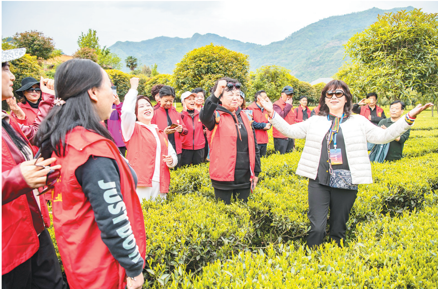
4月13日,在安康市平利县女娲茗茶高效有机茶园基地,众多文艺工作者与平利县室内爱歌合唱团团员在茶园“飙”歌。

3:3,重回同一起跑线。加时赛第13分钟,王霜禁区外远射破门。凭借这一进球,中国队总比分4:3获胜,拿下亚洲区最后一张东京奥运会女足门票。