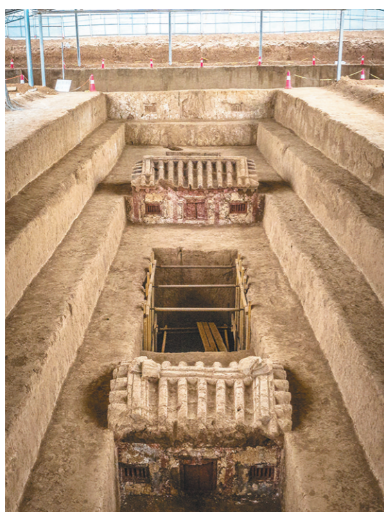
西安少陵原十六国大墓墓道上方土雕建筑全景(资料照片)。

本报讯(记者 薛生贵)4月13日,记者从省文物局获悉,4月12日至13日,2020年度全国十大考古新发现终评会在北京召开。经过4月12日全天的项目汇报会,4月13日上午,评委会经过综合评议,最终投票选出2020年度全国十大考古新发现。