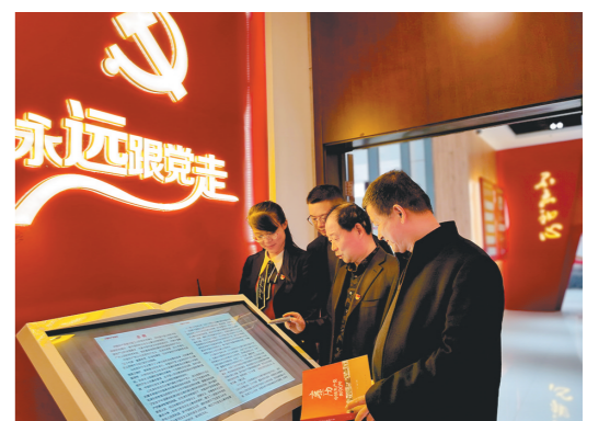
咸阳市烟草专卖局(公司)全面开展党史学习教育,引导广大党员领导干部树立学党史的思想和行动自觉。图为职工通过电子阅读设备学习党史。

一篇篇红色经典、一段段名篇佳作,把听众拉回烽火连天、激情燃烧的革命年代。经过紧张激烈角逐,宁强县总工会《秋天里的中国》勇夺一等奖;勉县融媒体中心《与妻书》、陕西建工第十建设集团有限公司工会《信仰》、西乡县文旅局工会《人民英雄张富清》获二等奖;中国人民银行汉中市中心支行工会《红色家书——最后的嘱托》、留坝县总工会《那支钢笔》、佛坪县总工会《红船,从南湖起航》、石门水库管理局工会《我的祖国》、汉中市审计局工会《有一首歌》获三等奖。