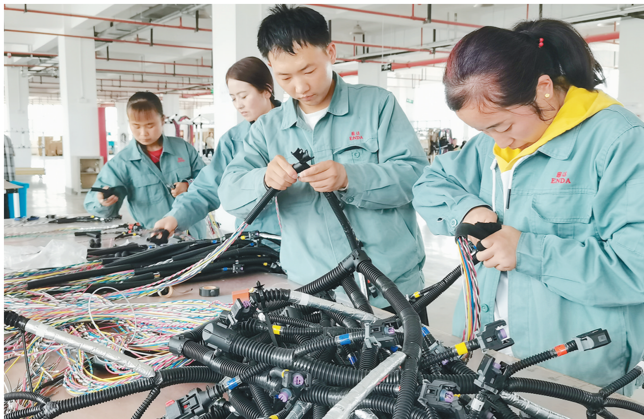
5月11日,陕西思达科技有限公司的工人正在加工车用电缆。

“下一阶段,我国货币信贷政策要按照‘不急转弯’的要求,保持连续性、稳定性、可持续性,继续引导好市场预期,助推经济恢复态势不断稳固。”董希淼说。