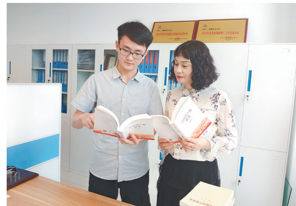
5月12日,中铁十二局四公司机械分公司党支部给党员发放了《中国共产党简史》等党史学习教育资料,通过学习,更加深入地解党的历史和辉煌成就,进一步坚定理想信念,真正领会了“学党史、知党恩、听党话、跟党走”的深刻含义。

近日,该公司党委中心组举办了党史学习教育“传承红色基因 牢记初心使命”主题党日活动,从党史学习教育中汲取智慧和力量,进一步坚定理想信念。据了解,长岭是我省老牌知名企业,在六十多年的发展历程中,企业始终坚持党的领导。尤其是改革开放的四十多年来,长岭积极贯彻党的各项方针、政策,实施保军转民、进行股份制改造,企业机制从计划经济向市场经济转变,长岭党委始终都发挥了坚强的领导核心作用,保持了企业的稳定,使企业改革发展各项工作得以顺利进行。