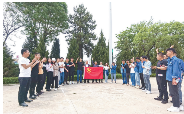
5月10日,洛川供电公司团支部组织30余名青年职工开展“追寻红色足迹,传承红色基因”主题团日活动。以“红色革命”系列主题趣味运动为主,培养青年员工在学思践悟中学党史、强信念、跟党走,引导他们立大志、明大德、成大才、担大任,激发干事创业激情。

《古田军号》讲述了红军从井冈山突围到闽西期间,通过古田会议确立“思想建党,政治建军”的建党建军原则,开辟中国革命成功之路的非凡历程。此次会议因此成为我党我军建设的伟大里程碑。观影活动进一步激发了炼化公司干部职工的爱党、爱国热情,大家表示,一定要传承好红色基因,继承好党的优良传统,为企业发展作出新的贡献。