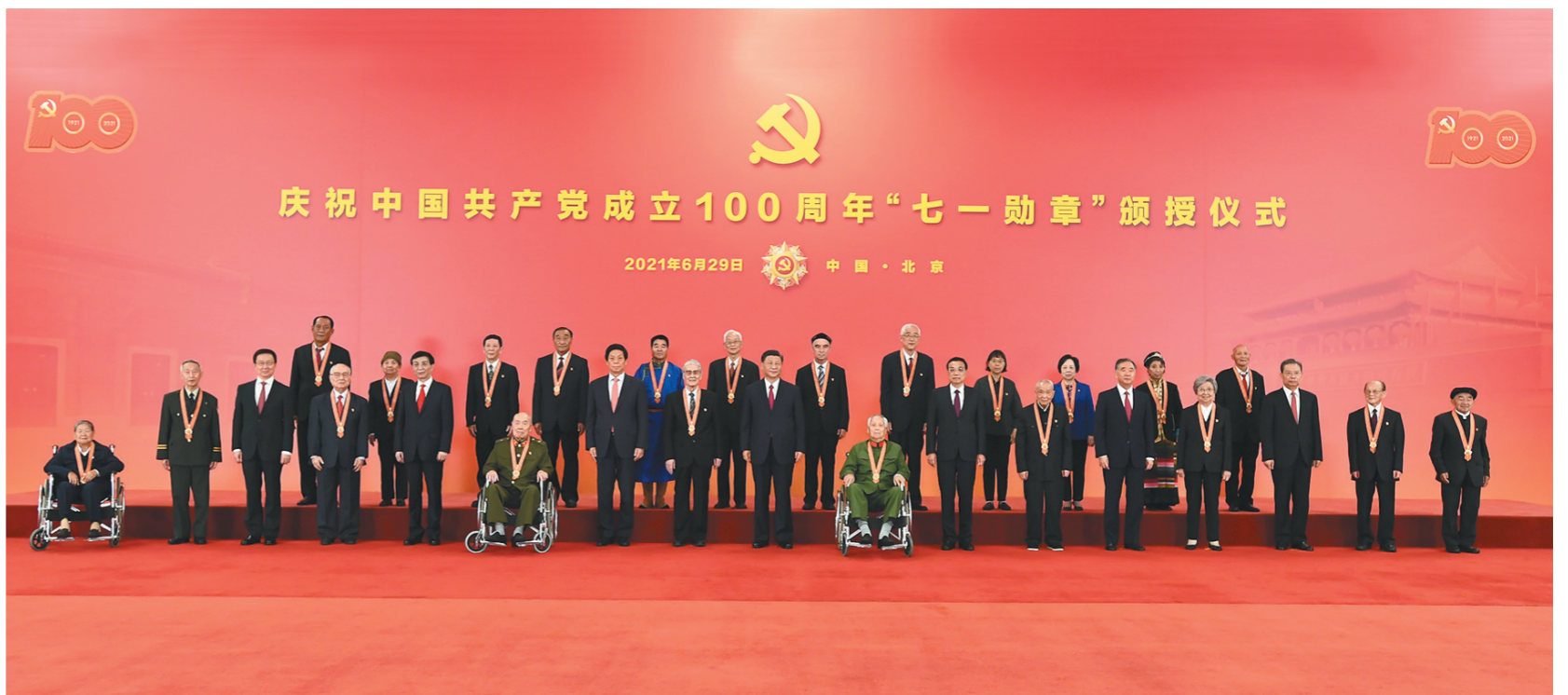
6月29日,庆祝中国共产党成立100周年“七一勋章”颁授仪式在北京人民大会堂金色大厅隆重举行。习近平等领导同志同“七一勋章”获得者合影。

新华社北京6月29日电 弘扬功勋模范精神,奋进伟大复兴征程。庆祝中国共产党成立100周年“七一勋章”颁授仪式29日上午在北京人民大会堂金色大厅隆重举行。中共中央总书记、国家主席、中央军委主席习近平向“七一勋章”获得者颁授勋章并发表重要讲话。习近平强调,一百年来,一代又一代中国共产党人,为赢得民族独立和人民解放、实现国家富强和人民幸福,前仆后继、浴血奋战,艰苦奋斗、无私奉献,谱写了气吞山河的英雄壮歌。在庆祝中国共产党成立一百周年之际,我们在这里隆重