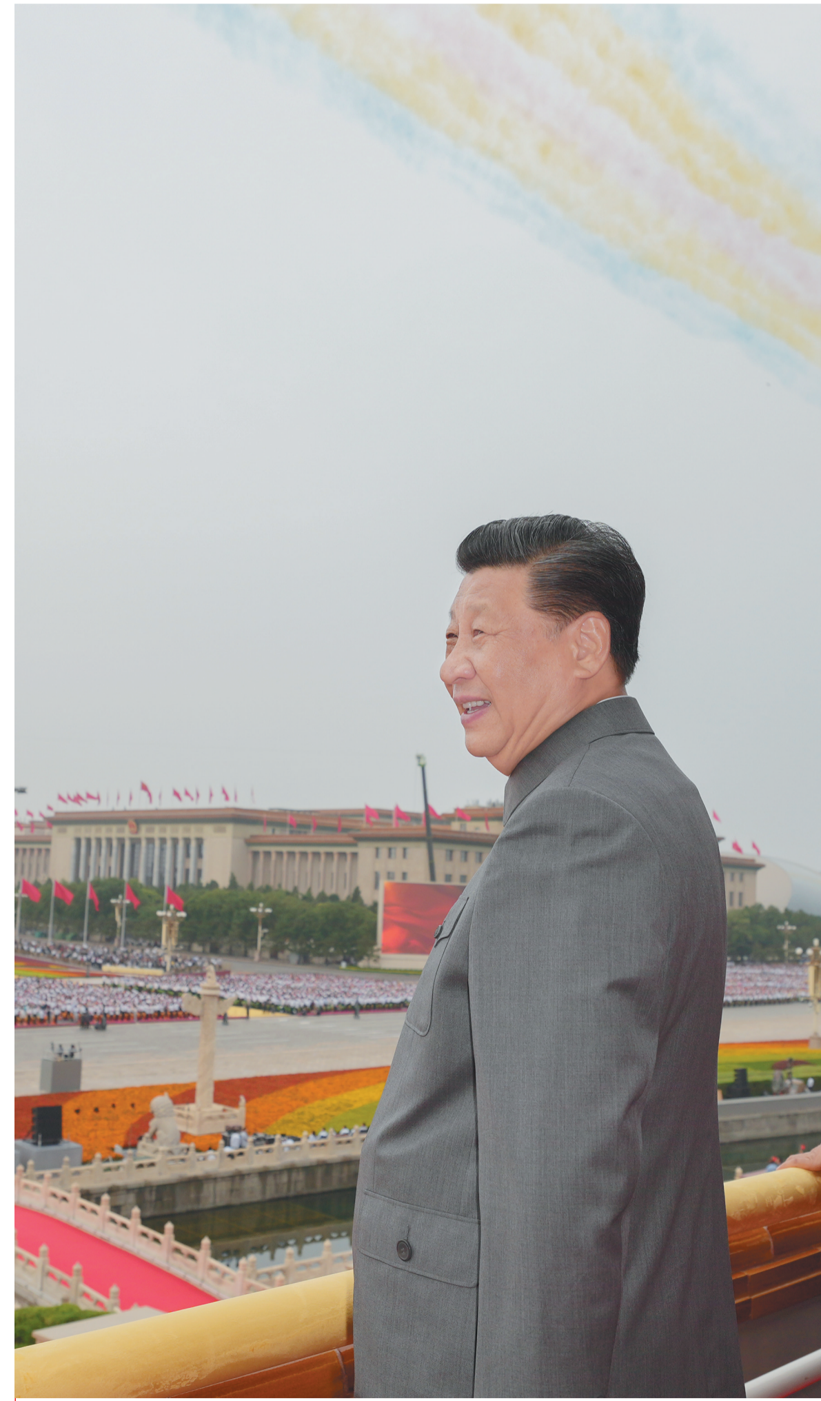
7月1日上午，庆祝中国共产党成立100周年大会在北京天安门广场隆重举行。中共中央总书记、国家主席、中央军委主席习近平发表重要讲话。这是习近平在天安门城楼上。

中共十八大、十九大代表，全国劳模，第六届国家级和工会工作的重要论述，不断增强“四个意识”、坚定“四个自信”、做到“两个维护”，去“四化”、增“三性”，在服务职工、服务陕西追赶超越大局中展现新作为、作出新贡献。