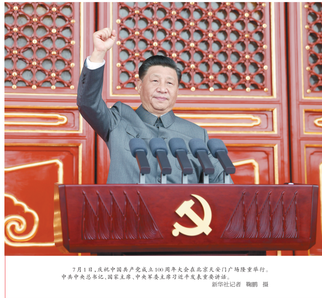
7月1日，庆祝中国共产党成立100周年大会在北京天安门广场隆重举行。中共中央总书记、国家主席、中央军委主席习近平发表重要讲话。

习近平指出，中国产生了共产党，这是开天辟地的大事变，深刻改变了近代以后中华民族发展的方向和进程，深刻改变了中国人民和中华民族的前途和命运，深刻改变了世界发展的趋势和格局。中国共产党一经诞生，就把为中国人民谋幸福、为中华民族谋复兴确立为自己的初心使命。一百年来，中国共产党团结带领中国人民进行的一切奋斗、一切牺牲、一切创造，归结起来就是一个主题：实现中华民族伟大复兴。（下转二、三版）