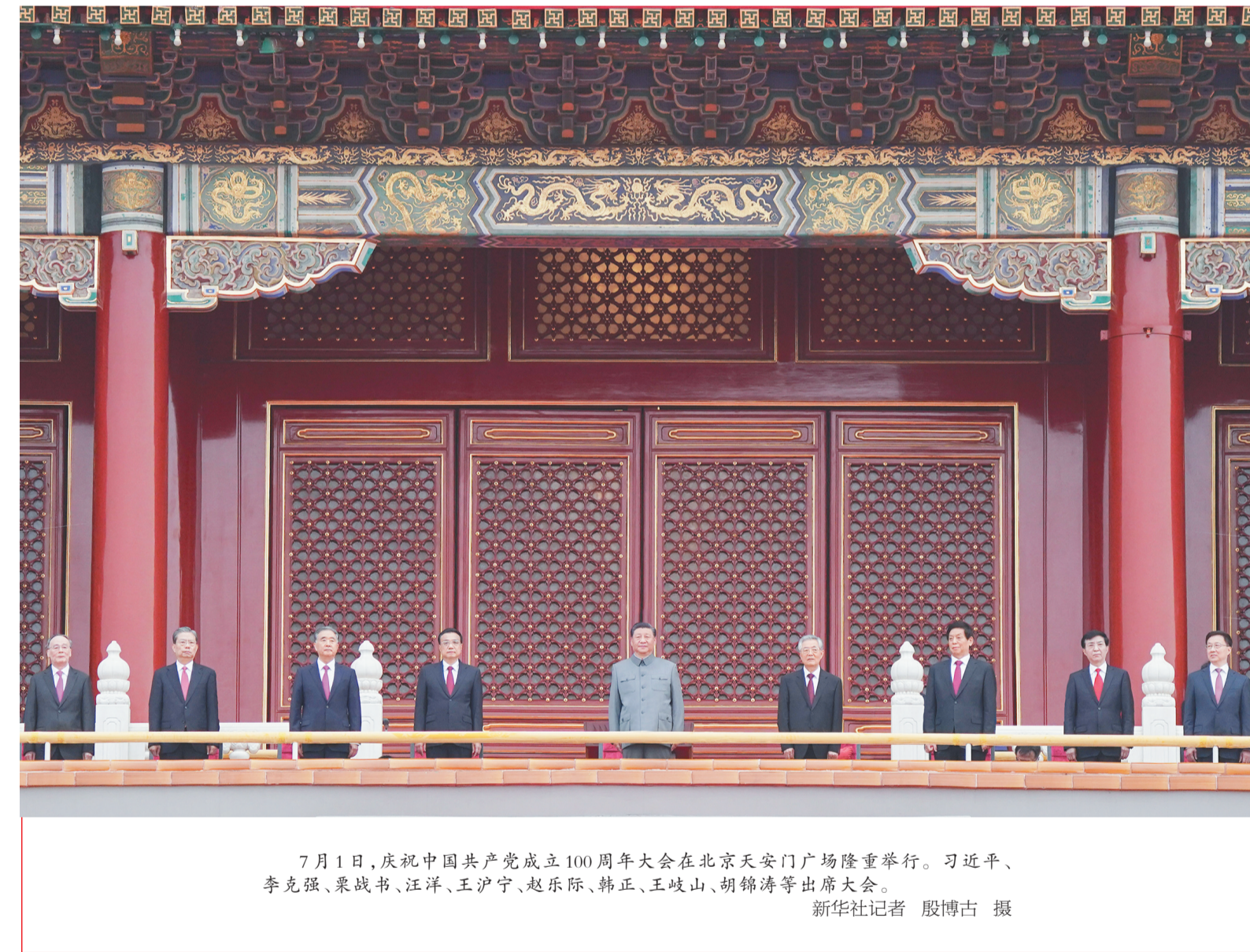
7月1日，庆祝中国共产党成立100周年大会在北京天安门广场隆重举行。习近平、李克强、栗战书、汪洋、王沪宁、赵乐际、韩正、王岐山、胡锦涛等出席大会。