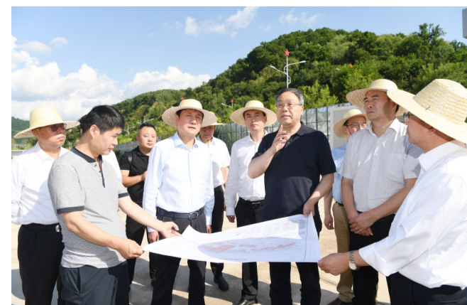
郭大为检查开工前准备工作。

本报讯(记者 王何军)7月1日下午，省人大常委会副主任、省总工会主席郭大为带队赴延安市，检查南泥湾劳模工匠学院建设项目开工前准备工作。