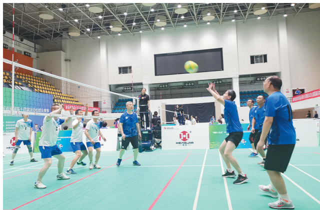
7月3日,“我要上全运”十四运会群众赛事气排球项目陕西省选拔赛在西安铁路局火车头体育馆举行。西北大学气排球队代表西安市参加本次比赛,夺得该组冠军,并获得了代表陕西省出战本届全运会气排球项目决赛的机会。 □何慧黠 张扩林

各市、县(区)学生资助管理中心生源地信用助学贷款办理咨询热线电话予以公布,详情请登录陕西省教育厅网站( http://jyt.shaanxi.gov.cn/ )查询,有办理需求的学生和家长可致电咨询。