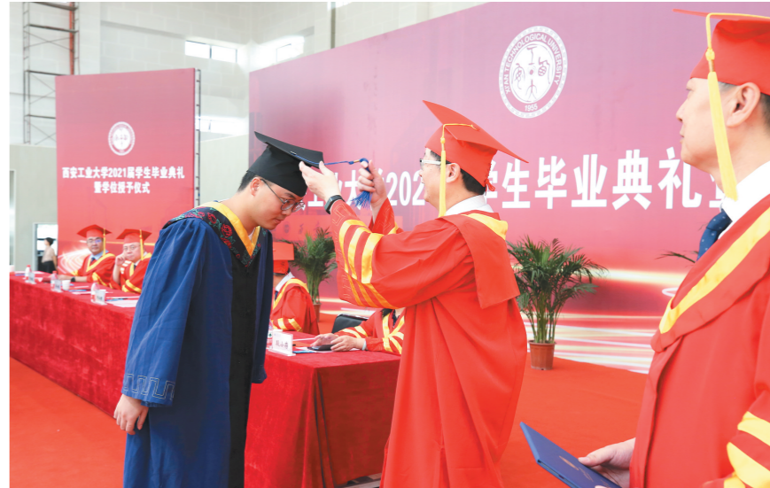
7月5日,西安工业大学举行2021届毕业生毕业典礼暨学位授予仪式。图为校领导为毕业生拨穗。