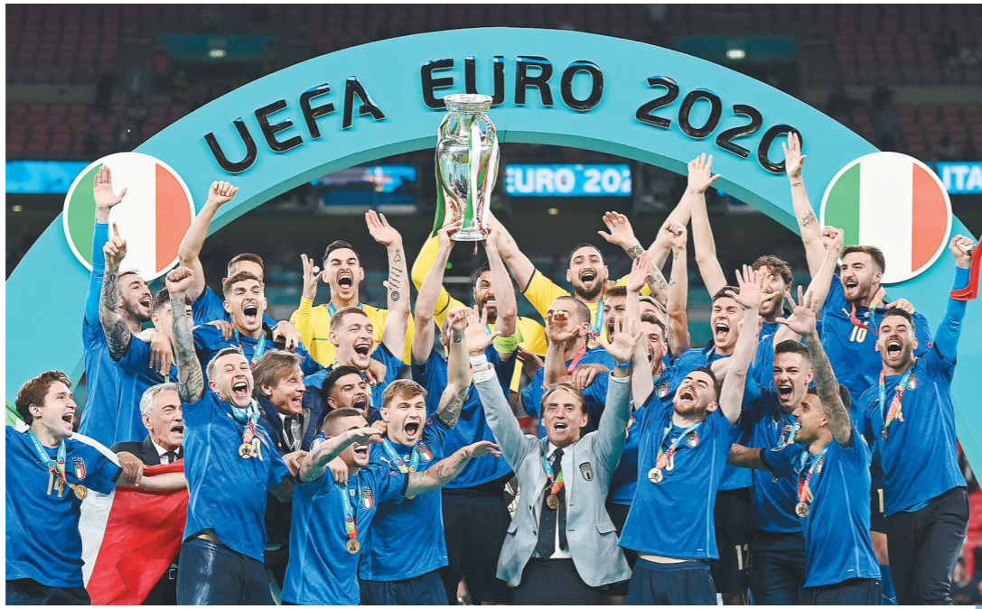
7月11日,意大利队球员庆祝夺冠。当日,在英国伦敦进行的欧洲足球锦标赛决赛中,意大利队与英格兰队在120分钟...