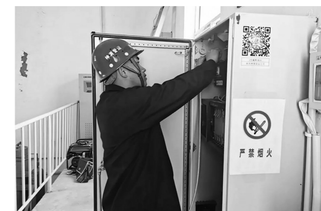
近日,由神渭管运公司机电设备管理中心泵输车间延长检修组牵头,外协检修中心人员配合,对沿线未做接地或接地电阻超标设备设施进行整改,为保障设备设施防雷接地的安全奠定了坚实基础。

据悉,该分公司项目部秉承“树牢安全意识,铸造精品工程”理念,弘扬“快、准、实、好”作风,不断加大人力、机械等资源投入,形成了多个作业面平行施工和24小时倒班作业的抢工模式。同时,在施工过程中严把质量关,从各类施工材料质量,到坚守工程质量,再到标准化施工,每道工序都精益求精,用“工匠精神”锻造一流精品工程,助推区域高质量发展。 (贺展展)