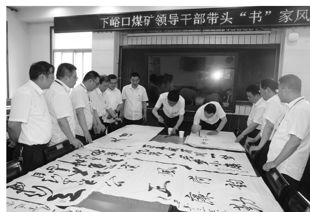
近日,韩城矿业公司下峪口矿开展以“德润陕煤”为主题的廉政文化作品征集活动。矿党政工领导带头书写廉政家风语录,一句句廉政格言跃然纸上,在接受艺术熏陶的同时,荡涤了心灵深处的尘埃,接受了廉政教育的洗礼。