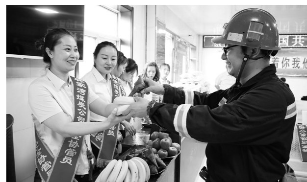
自“我为群众办实事”实践活动开展以来,陕北矿业韩家湾公司致力于解决好职工群众最关心、最实际的问题,组织工家属协管员到井口开展慰问活动,让亲情关爱成为筑牢安全生产防线的一道靓丽风景线。