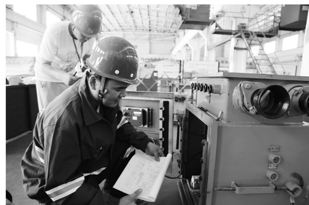
为进一步激发职工学习技能的积极性,加快技术型人才成长步伐,为企业高质量发展提供坚实的人才保障,近日,黄陵矿业机电公司组织6个工种66名职工开展技能竞赛活动。图为参赛选手进行电气线路连接。

受到企业的关心与温暖。 你的诉求,我来落实。为更好地问需于民、问计于民,该中心利用OA办公系统,开通了党委书记信箱,动态推进“我为群众办实事”大走访,常态化开展“党政工接待日”活动,定期组织班子成员、支部书记与班组长职工分层对话,深入开展科级管理人员分片包联,架起畅通无阻的职工意见传递渠道。自“我为群众办实事”开展以来,党委信箱陆续收到50余条“小建议”,其中38条已经得到落实。 (张坤妮)