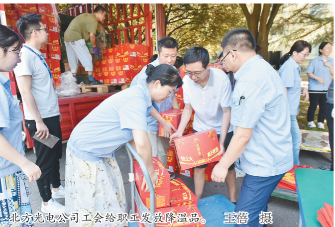
北方光电公司工会给职工发放降温品。