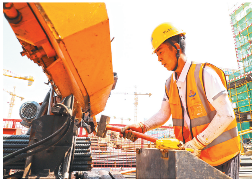
近日,西安市最高温达到39℃,体感温度更是达到45℃以上。在中建五局西北公司西安电子谷项目建设现场,G区主体施工作业面上有400余名工人在高温下坚持作业,项目部根据高温天气进行了作息调整。

针对劳务工,由于劳务协议与劳动合同的法律地位不同,用人单位可以不予支付高温津贴。但是,劳务工可以通过在劳务协议中与用人单位就高温津贴进行约定,以获得高温津贴。