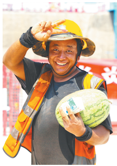
中建五局西北公司西安电子谷项目部为施工现场的工人发放西瓜、藿香正气水等防暑降温物资。