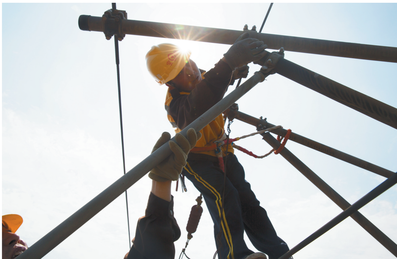
7月28日,气温高达39摄氏度,中国铁路西安局集团有限公司宝鸡供电段武功接触网工区职工在陇海线西安-宝鸡段马堯坡站检修铁路供电设备。

6月15日,省总发出《给各企事业单位发放降温费和高温津贴的提示函》,提醒各用人单位为从事高温作业的劳动者按时足额发放降温费和高温津贴。目前正是酷暑时期,工会、企业有哪些好做法?职工享受到了哪些服务?还有哪些疑问?今天,本报推出《“清凉”送心坎 政策到一线 职工得实惠》专题,对这些问题进行一一解答,敬请关注。