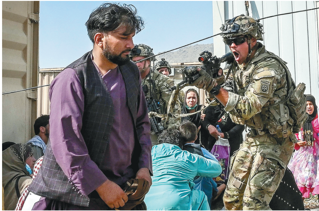
8月16日,在阿富汗喀布尔机场,一名美军士兵用枪指向一名阿富汗男子。