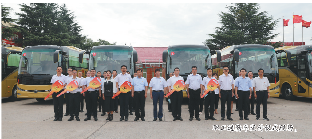
职工通勤车交付仪式现场。

“阵地化”守护职工群众精神家园。深入推进党史学习教育,开展“永远跟党走”系列活动。立足“三协一团”,推动职工文化精品创作,搭建文化传承载体,以文化精品涵养优秀“澄合文化”,展示职工精神风貌和企业形象。积极组织参加省总工会“永远跟党走 奋进新征程”主题活动,择优报送了“我身边的党员故事”微视频6部,大合唱视频2部,摄影作品10幅,书画作品22幅。微视频荣获一等奖2个,二等奖1个,三等奖1