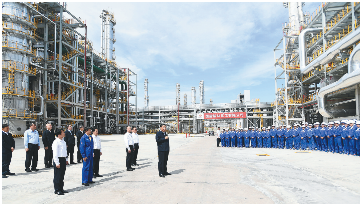
9月13日至14日,中共中央总书记、国家主席、中央军委主席习近平在陕西省榆林市考察。这是13日上午,习近平在国家能源集团榆林化工有限公司考察时,同企业职工代表亲切交流。

新华社榆林9月15日电 中共中央总书记、国家主席、中央军委主席习近平近日在陕西省榆林市考察时强调,要坚决落实党中央决策部署,坚持稳中求进工作总基调,完整、准确、全面贯彻新发展理念,弘扬光荣革命传统,解放思想、改革创新、再接再厉,切实抓好统筹疫情防控和经济社会发展各项工作,更好统筹发展和安全,更好服务和融入新发展格局,谱写陕西高质量发展新篇章。