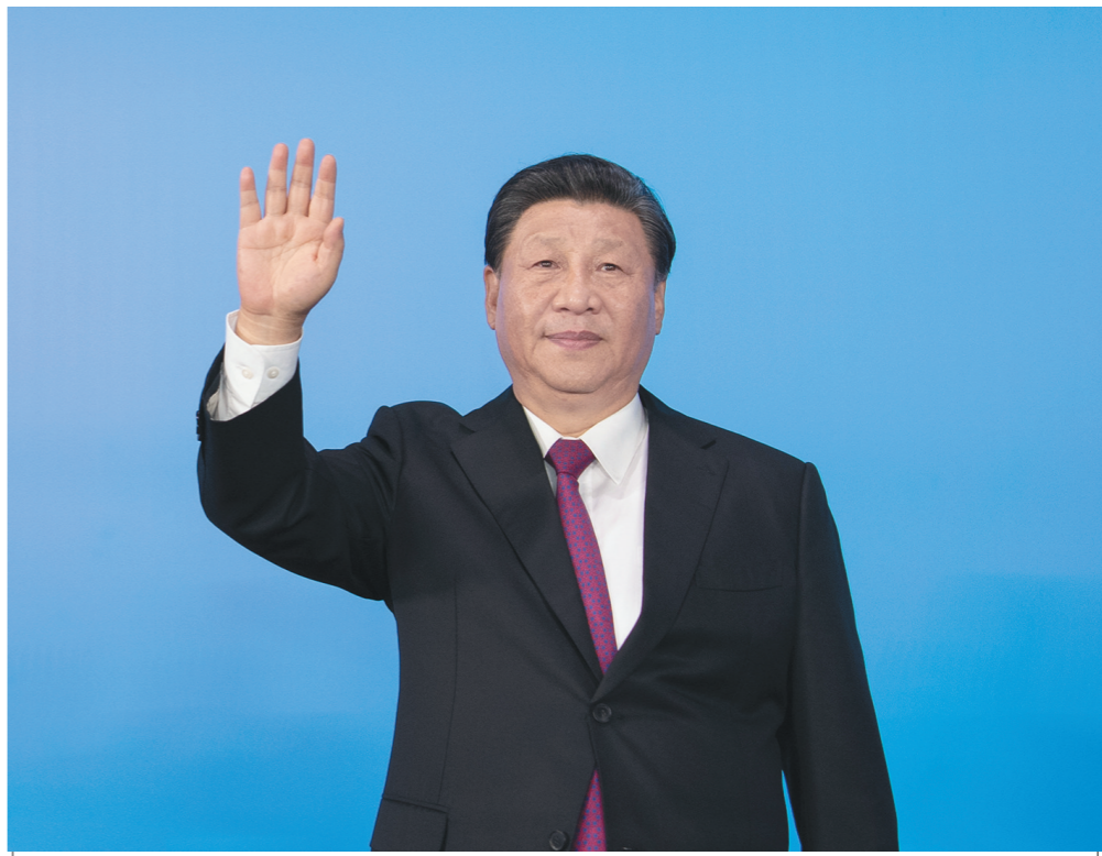
9月15日晚,中共中央总书记、国家主席、中央军委主席习近平在陕西省西安市出席中华人民共和国第十四届全国运动会开幕式并宣布运动会开幕。