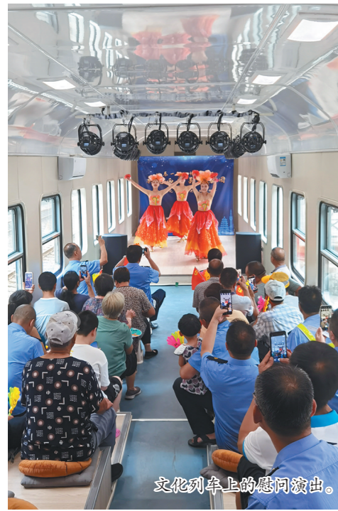
文化列车上的慰问演出。

以“走进职工心里,和职工一起互动”为目标,坚持把文化送到职工身边,组织文艺小分队深入开展“文化送一线”活动。坚持再小的站区、再少的职工、再陡的山路,一站都不缺、一个都不少、一点都不省,慰问站区由过去的每年50场