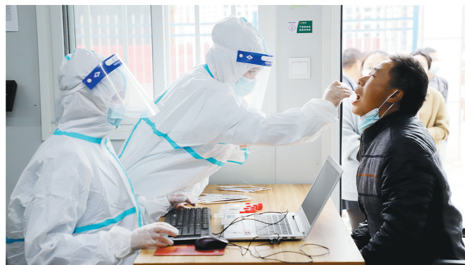
连日来,陕建发展集团针对建筑工地存在流动人口多、人员构成复杂、施工交叉作业、工种多等特点,全面落实关于疫情防控工作各项部署要求,全力保护员工生命安全和身体健康。图为该公司为项目工地农民工进行核酸检测。

农高会上,造型独特的针织小玩偶,栩栩如生的龙凤呈祥鞋垫,憨头憨脑的虎头枕……一件件精美的非遗手工艺品受到了参观者的喜爱,三秦妇女在乡村振兴中用一双双巧手贡献着智慧和力量。 实习记者 郝佳伟