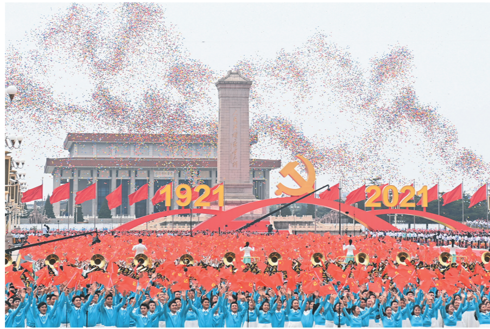
2021年7月1日上午,庆祝中国共产党成立100周年大会在北京天安门广场隆重举行。这是庆祝大会现场放飞气球。新华社记者 李尔 摄

今天,秉持“制度优势是一个国家的最大优势”,党的十九届四中全会在党的历史上首次系统描绘和部署中国之治“制度图谱”,筑牢中国长治久安的制度根基。