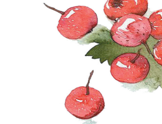
社址:西安市莲湖区239号 邮政编码710003 广告经营许可证:陕工商广字01—018号