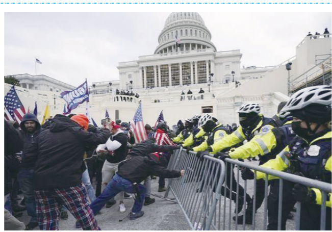
2021年1月6日,在美国华盛顿,时任美国总统特朗普的支持者在国会大厦外试图冲破警察的围栏。

今年1月6日,是美国国会山骚乱一周年的日子。这场导致包括1名警察在内的5人身亡、140多名警察受伤、700多人被捕的暴力冲击国会事件被视为“美国历史上的至暗时刻”。在一周年的日子,拜登政府和国会准备以演讲、反思、默哀、讨论、回顾、守夜祈祷等丰富形式加以纪念。但在分析人士看来,美国两党迄今并未认真追溯事件的本质与根源,依然从党派政治出发,利用这一事件谋求政治利益。拜登执政近一年来,也未能弥合骚乱给美国政治、社会造成的裂痕。由于美国政治极化加剧、社会撕裂加深,不排除在今后选举中重演类似骚乱的危险。