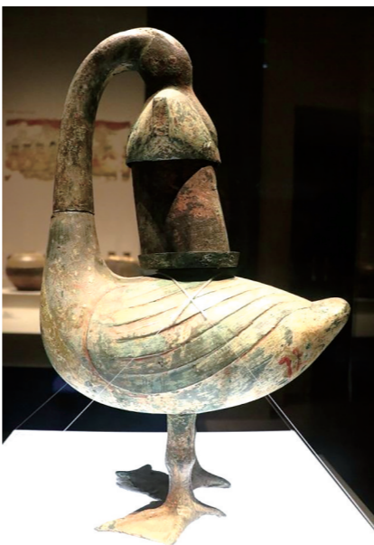
陕西历史博物馆里的雁鱼铜灯。

雁鱼铜灯的设计理念体现在它的内部构造上。它的内部构造十分巧妙,雁体是灯的主要构件,雁头与雁体以子母口相接,灯盘(鱼身)及雁头、