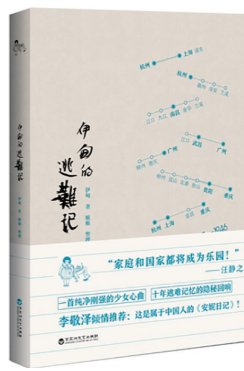
《伊甸的逃难记》 伊甸著,雁雁整理,百花洲文艺出版社

大周村,一个有着六百多年历史、两千多人的村庄,“一个热乎乎的真实人间”,既是中原乡村当下风貌的缩影,也是中国广袤乡村的现实缩影。离开故乡四十年后,作者重返魂牵梦萦的大周村,倾听、观察与采访,完成了这部长篇虚构作品,纤毫毕现地呈现了当下农村巨变后的世态人心与乡村表情。