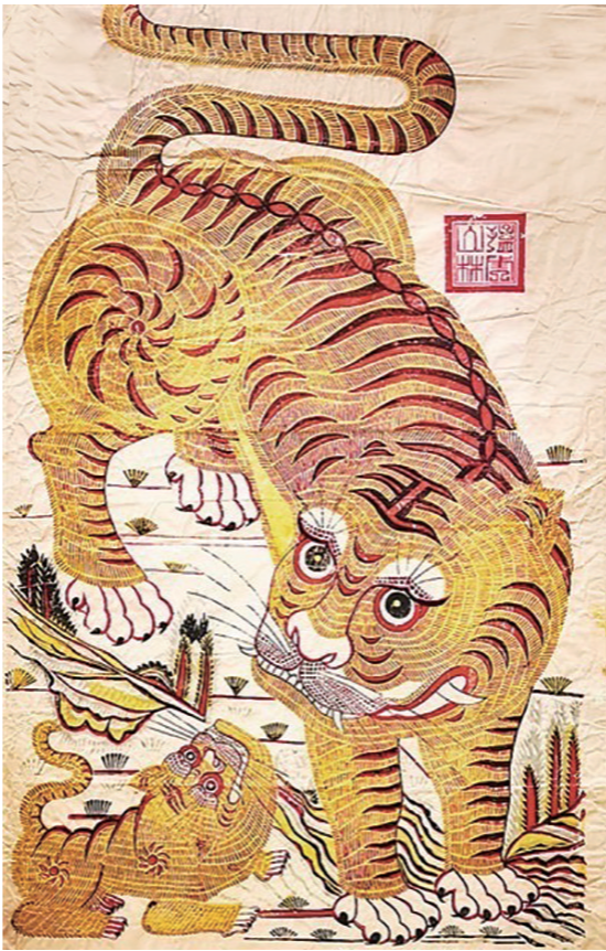
《山林猛虎》 杨家埠年画

《山林猛虎》是山东杨家埠辟邪纳福类年画的典型题材。该作品为母子花斑虎写实造型。母虎为下山虎,白眉长须,身姿矫健,气势如虹。左下角为一小虎,匍匐卧地,昂首顾盼,望向母虎。为了突出虎的威猛气势,山林背景被简化为数丛草木。中国人的观念中,老虎不仅能够驱鬼镇宅,还能保护财富。俗谚“镇宅神虎多清静,当朝一品封兽王,不立深山合松林,持守金银聚宝盆。”