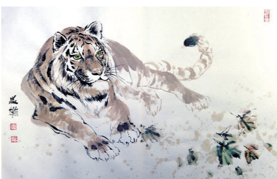
《十二生肖寅虎》 刘森翰

上海博物馆藏西汉“鎏金虎镇”呈卷卧状,昂首,颈处有项圈,像是大型的宠物猫,形态颇为可爱。在秦汉及之前,人们主要的起居方式是“席地而坐”。为了避免起身落座时折卷席角或牵挂衣饰,从而影响仪态,便出现了席镇,即席席四角的重物。“虎在传统文化里虽然是百兽之王,但这些文物里的虎看起来非常温顺。它们好像被剥去了暴力的一面,融入传统文化中。”上海博物馆副馆长陈杰介绍,“通过这些虎的形象展现,传达辟邪、镇灾、纳福的含义。” □赵书 钟菡