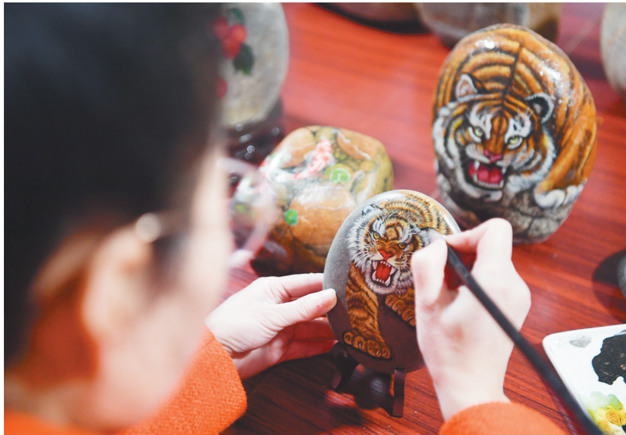
1月27日,农民画家张娟在工作室进行创作。农历虎年将至,西安市鄠邑区的农民画家以石材为画布,创作“虎”主题作品迎接新春佳节。