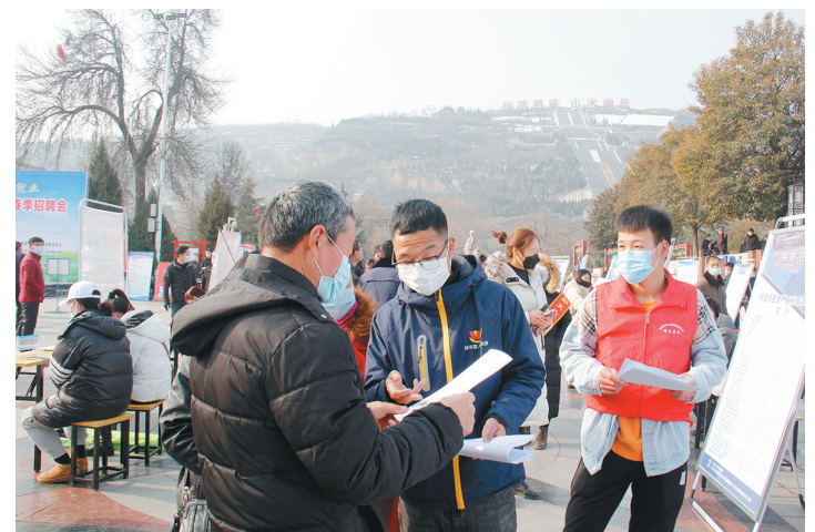
近日,彬州市人社局组织开展高质量就业春季招聘会,着力解决务工人员“就业难”及企业“用工难”问题。

赛事共有5个奖项。奖金设置方面,赛事将按照世界田联“精英标准”赛事的奖金标准,马拉松项目冠军上调为1.2万美元。赛道沿途设置了“上合国家风情赛道”“美丽校园青春赛道”“乡村田园果蔬赛道”“文旅融合非遗赛道”四条特色赛道,同时开展杨凌绿色食品品鉴推广活动。