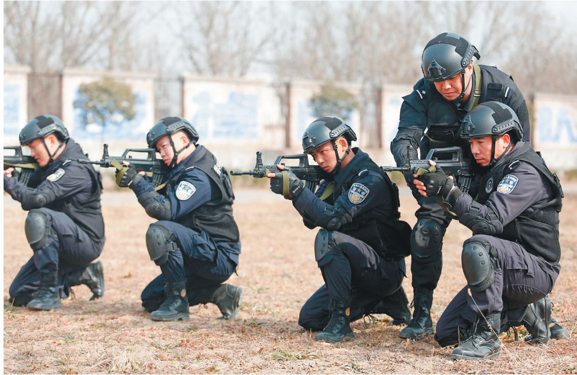
2月16日,渭南市澄城县公安局巡特警大队队员进行持枪动作训练。

不用天天挤早高峰地铁,不用每天为打卡的“最后一秒”焦虑,可以自己选择办公地点……2月14日,在线旅游平台携程宣布,公司将实行混合办公制,允许员工每周三和周五选择1-2天远程办公。这一举措引来了一众网友的羡慕:“又是别人的公司”“我酸了”…… 近年来,“996”“大小周”成了不少企业员工的心结。而这些也并不一定给企业带来良好的工作绩效,反而让不少员工的工作效率下降,催生员工幸福感低下等问题。 企业只有“以人为本”,才能“留人留心”。近年来,一些企业公布了多项针对员工关怀的“暖心计划”,推出“员工退休养老方案”,取消“大小周”的工作安排……此次,携程所推行的混合办公模式,是企业“以人为本”的又一有益尝试。 让人欣慰的是,携程此次的尝试,并非“拍脑门”的决定,而是历经半年探索的结果。自去年8月以来,1600多名员工试行混合办公,结果显示,员工参与意愿上升至近六成,在绩效无明显影响的情况下,离职率下降约三分之一。 让员工根据需要灵活办公,免去通勤麻烦,拥有更多时间陪伴家人,既为企业的管理增添一份温情,也让员工的幸福感、满意度获得提升。混合办公制不仅有利于减少交通堵塞、环境保护、缓解高房价和地区间差异,还有利于家庭和谐、女性职业发展和提高生育率。此举实现了企业、员工和社会发展的多赢。 当然,混合办公作为一种新的工作模式,能否从“选配”走向“标配”,还需要实践的检验。部分员工和主管所担心的“难以管理”“工作家庭没界限”等问题,也对员工的自我管理和企业的综合管理提出了更高的要求。 但是,这一拥抱变化、以人为本的举措是一次值得点赞的探索,值得更多企业思考、借鉴与尝试。(邱霖)