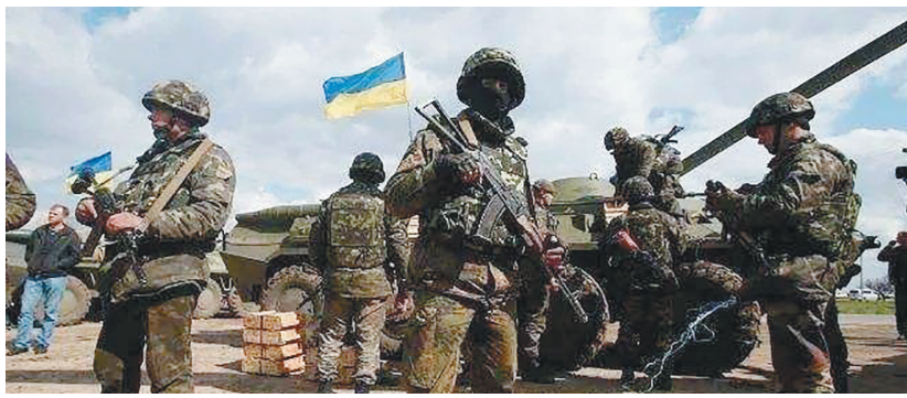
2月15日,俄罗斯国防部表示已从乌克兰南部及西部附近撤出一些俄军部队,返回军事驻地。

然而,就在周二,一切出现戏剧性逆转。俄方宣布部分俄军结束演习,开始从俄乌边境撤军;俄总统普京表态,不希望发生战争,将继续与西方谈安全保障问题。美国虽然心存疑虑,但也咬定外交窗口还开着。