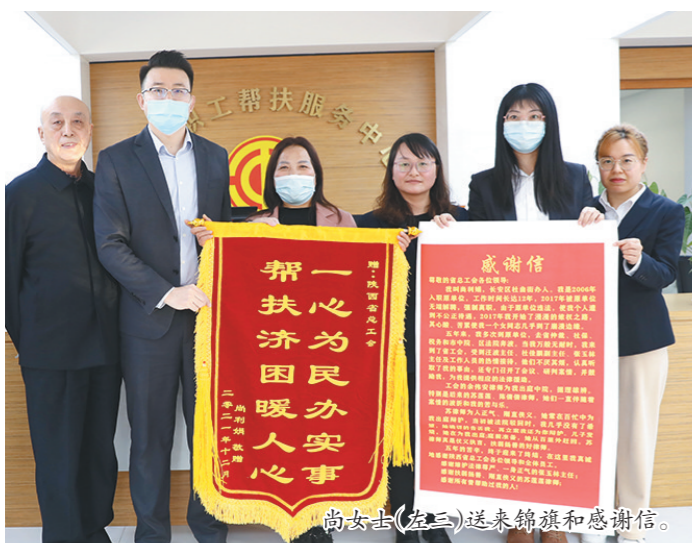
尚女士(左二)送来锦旗和感谢信。