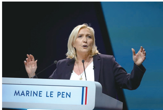
这是2月5日,法国极右翼政党“国民联盟”候选人玛丽娜·勒庞在兰斯出席竞选集会。