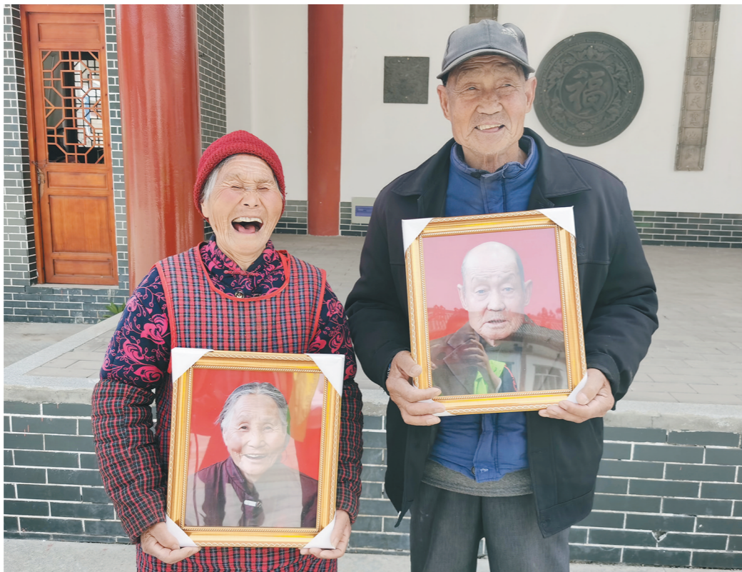
领到照片的老两口。