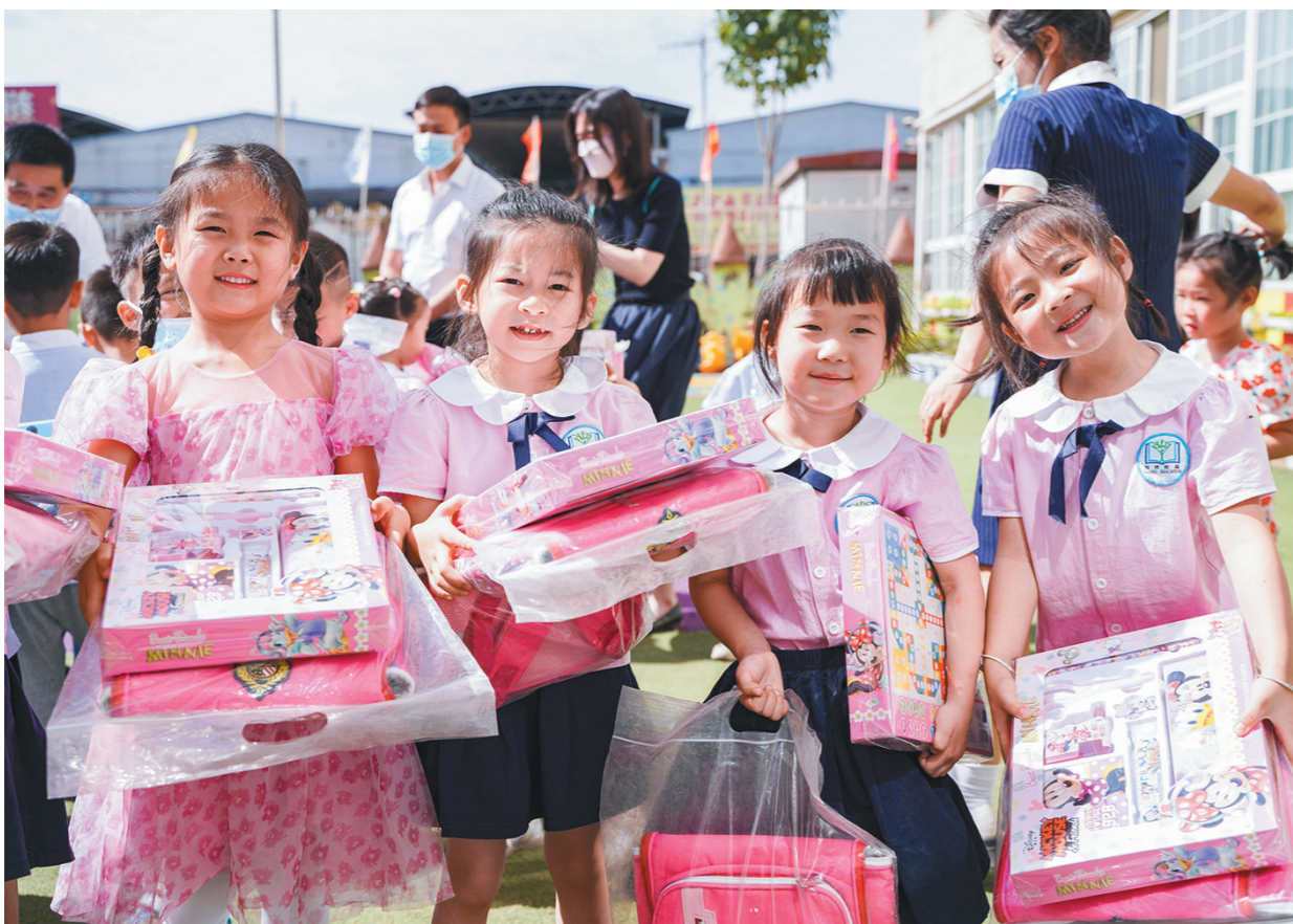
5月30日,省财贸金融轻工工会在陕西祥云物流有限公司园区幼儿园开展庆“六一”走访慰问活动。期间,为40余名新业态劳动者子女送上价值1万余元的书包、文具盒等学习用品。