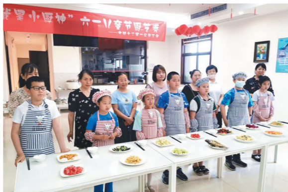
近日,中铁十二局一公司工会组织职工子女开展厨艺大赛,以别样方式迎“六一”。