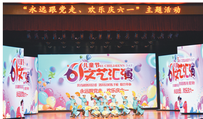
5月31日,洛川县县委、延安炼油厂子校联合举办文艺汇演,庆祝“六一”儿童节。