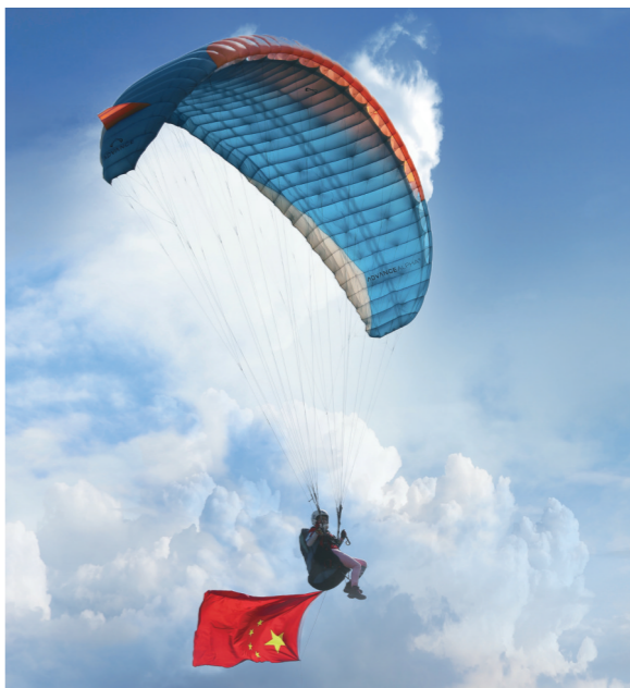
我爱祖国的蓝天

这次,我又梦见了海边,只不过在梦中,口罩不再出现在人们脸上,四海之间的游客纷至沓来,海边又恢复了往日的熙攘。 (作者单位:陕西师范大学)